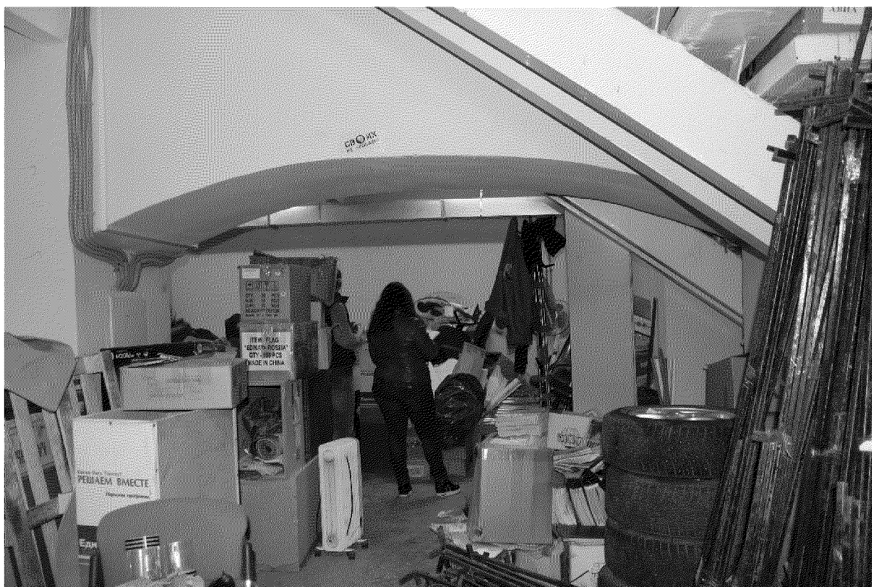
Видовая точка № 11 Фрагмент помещения подвала. Лучковая арка.