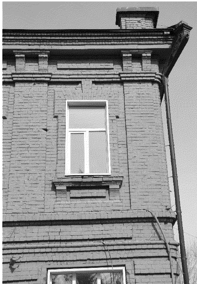
Видовая точка № 7 Фрагмент торцевого (южного) фасада