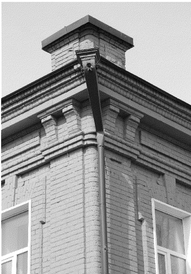
Видовая точка № 6 Юго-восточный угол здания