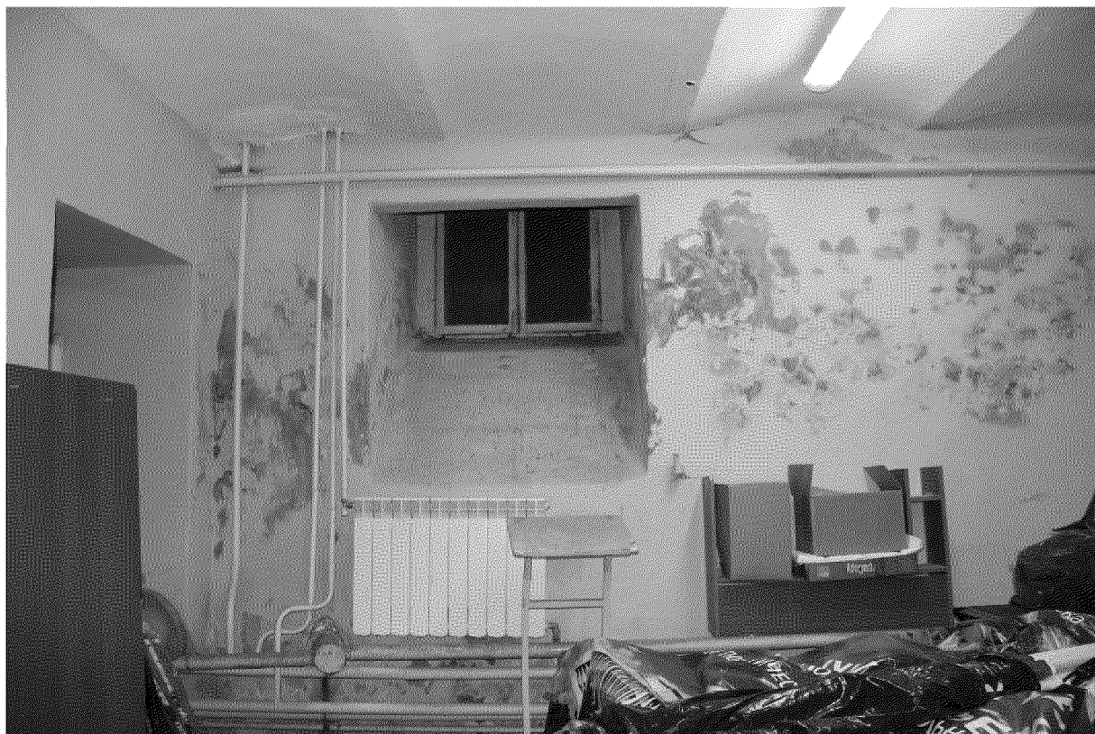
Видовая точка № 10 Фрагмент помещения подвала. Кирпичные своды перекрытия. Окно подвала.