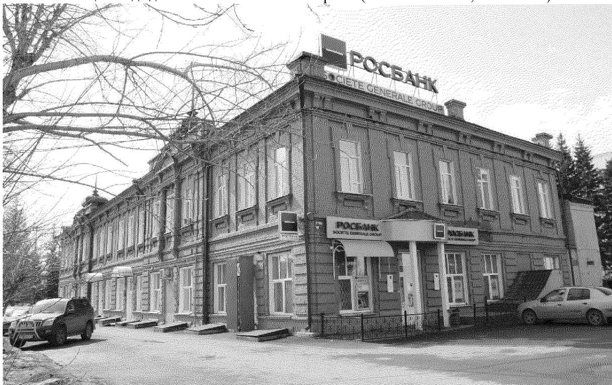
Видовая точка № 2

Общий вид здания с юго-восточной стороны