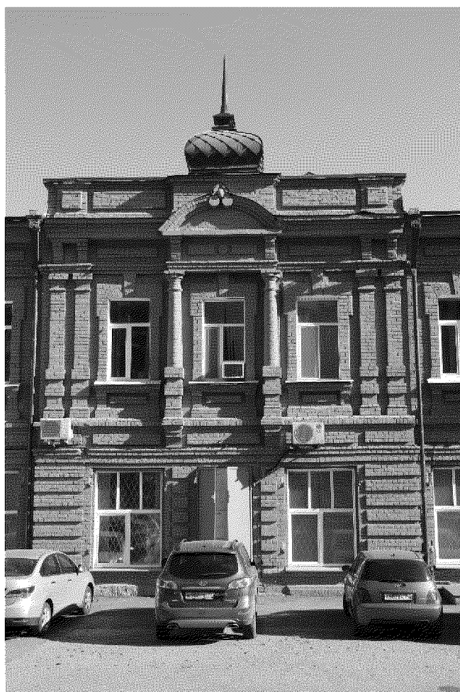
Видовая точка № 4 Фрагмент западного фасада. Ризалит