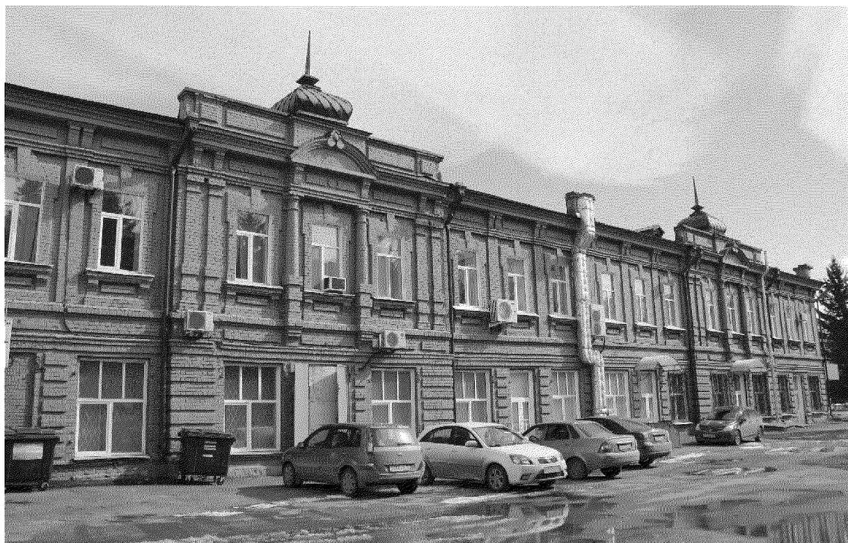
Видовая точка № 3 Западный фасад здания