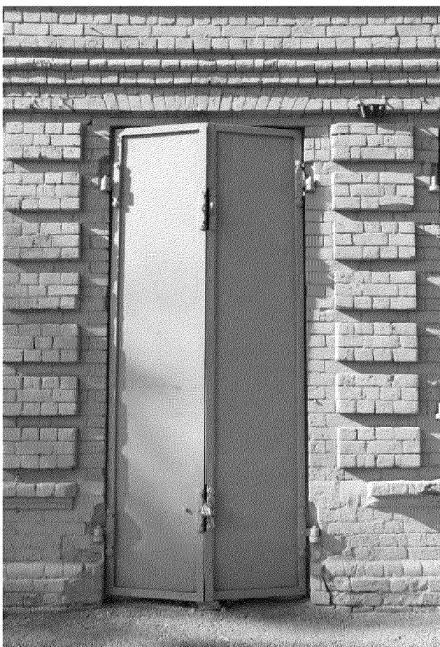
Видовая точка № 8 Металлические ставни дверного проема