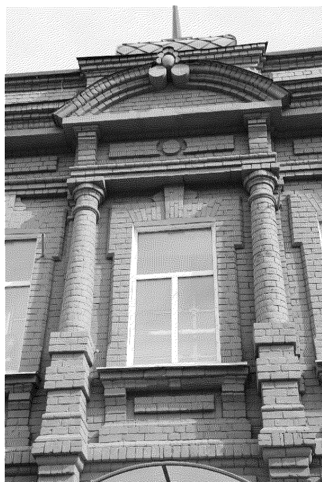
Видовая точка № Фрагмент декора ризалита западного фасада