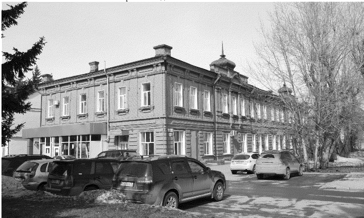
Видовая точка № 1

Фотографические изображения предмета охраны объекта культурного наследия регионального значения «Корпус торговых лавок», 1904 г., расположенного по адресу: Томская обл., г. Томск, Ленина площадь, 8 Автор снимков: архитектор 1 категории ОГАУК "Центр по охране памятников" Лырова Е.В. дата съемки: 13.04.2017 г.