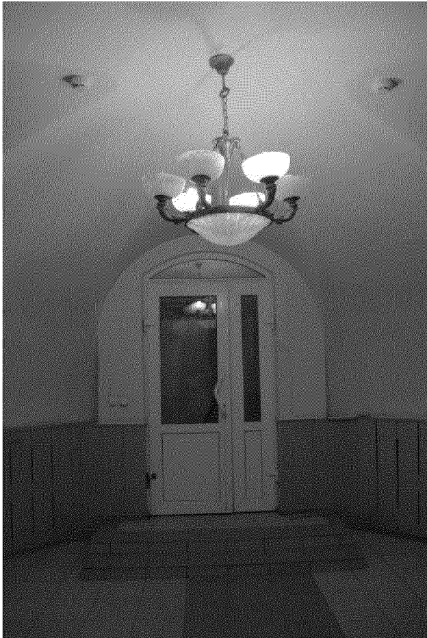
Видовая точка № 9 Окно 2-го этажа главного фасада