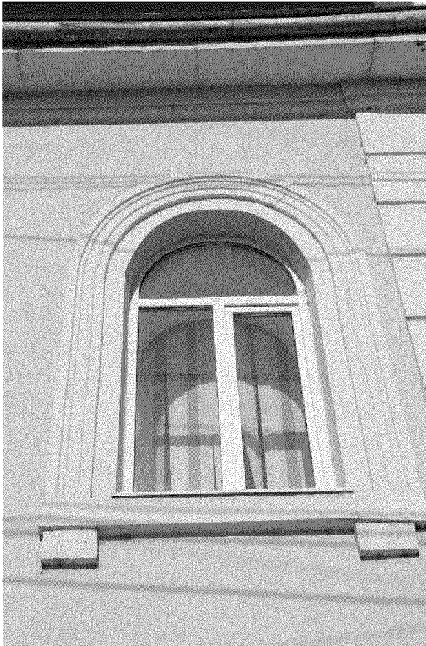
Видовая точка № 6 Окно 2-го этажа главного фасада