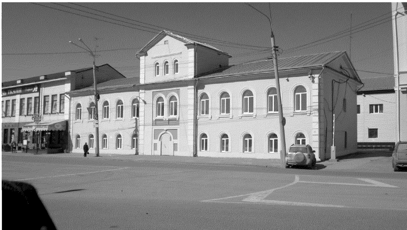
Видовая точка № 3. Общий вид здания с пл. Ленина