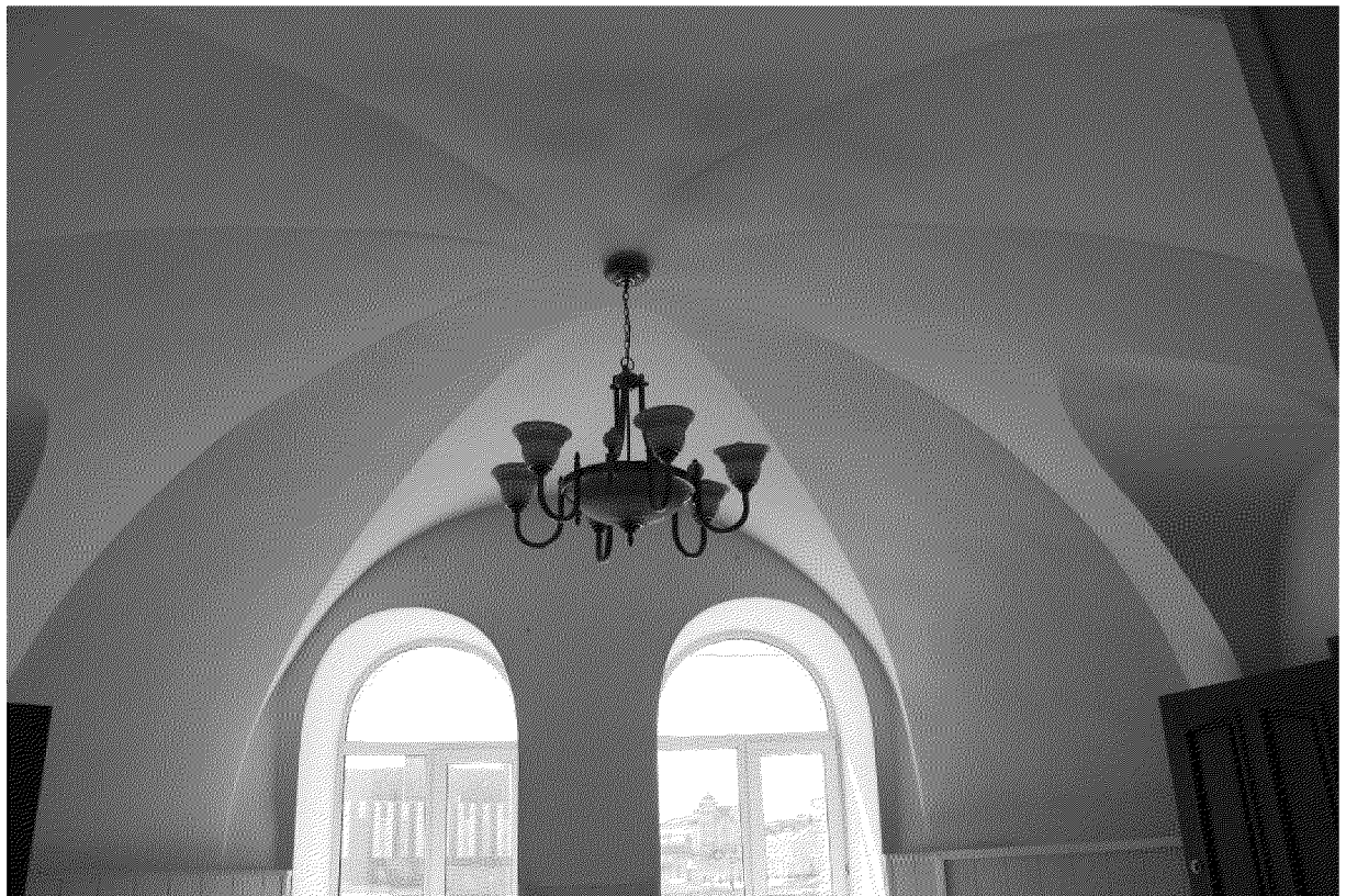
Видовая точка № 11. Восьмигранный кирпичный с распалубками свод холла 2-го этажа