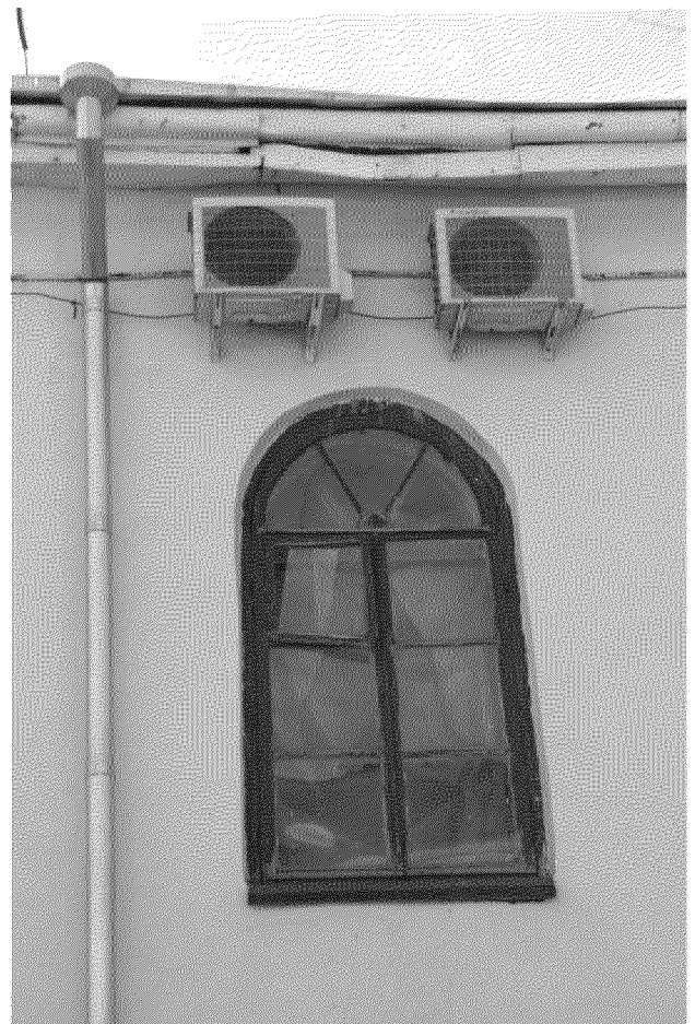
Видовая точка № 7 Окно 2-го этажа дворового фасада