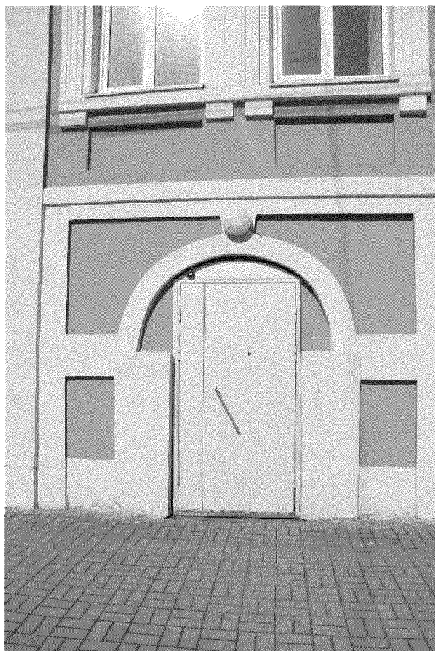
Видовая точка № 5 Парадный вход главного фасада