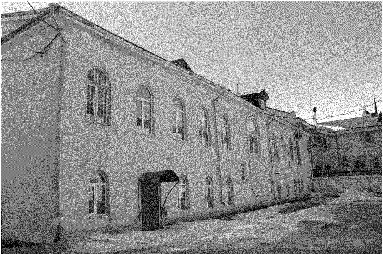
Видовая точка № 8 Дворовый (северный) фасад здания