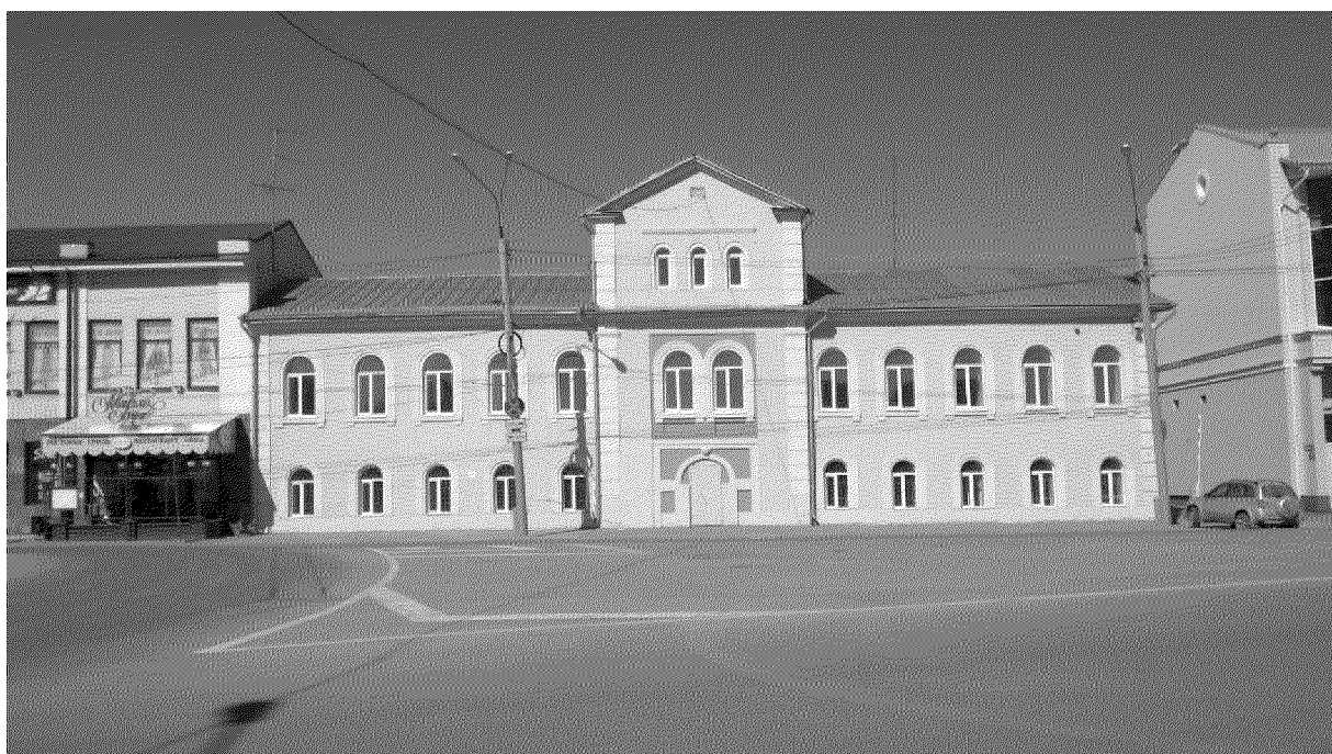
Видовая точка № 2. Главный фасад здания. Вид с пл. Ленина