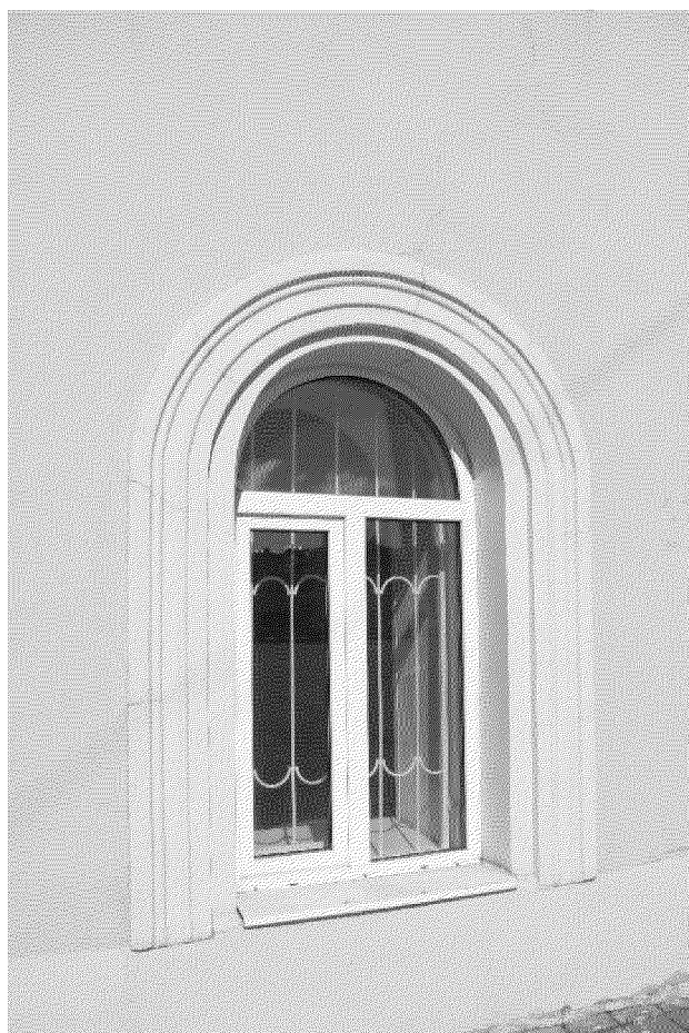
Видовая точка № 4 Окно 1-го этажа главного фасада