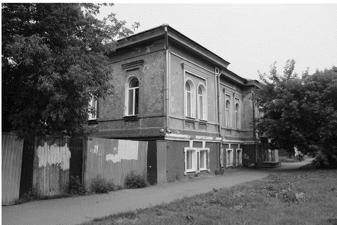
Видовая точка № 2 Общий вид здания по ул. Крылова