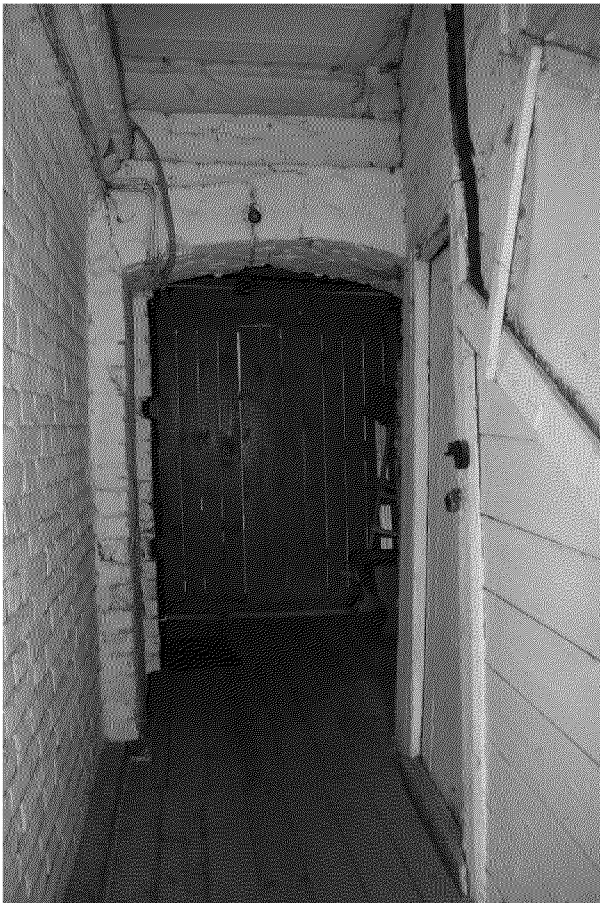
Видовая точка № 14 Лучковый проем 1-го этажа пристройки (сквозной проем выхода во двор)