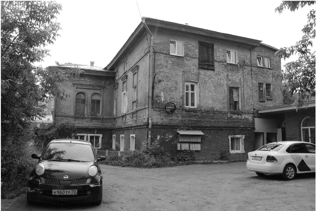
Видовая точка № 7 Общий вид дворового (западного) фасада