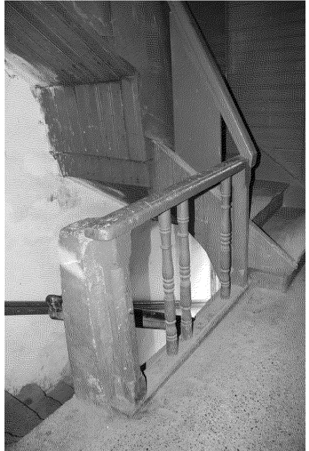
Видовая точка № 17 Фрагмент ограждения лестничной площадки. Лестница на мезонин