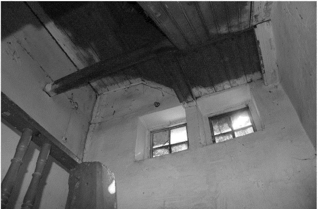
Видовая точка № 18 Помещение лестницы дворовой пристройки