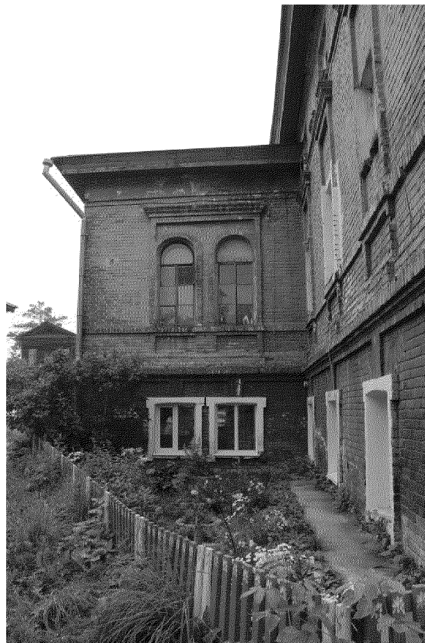
Видовая точка № 6 Фрагмент дворового фасада