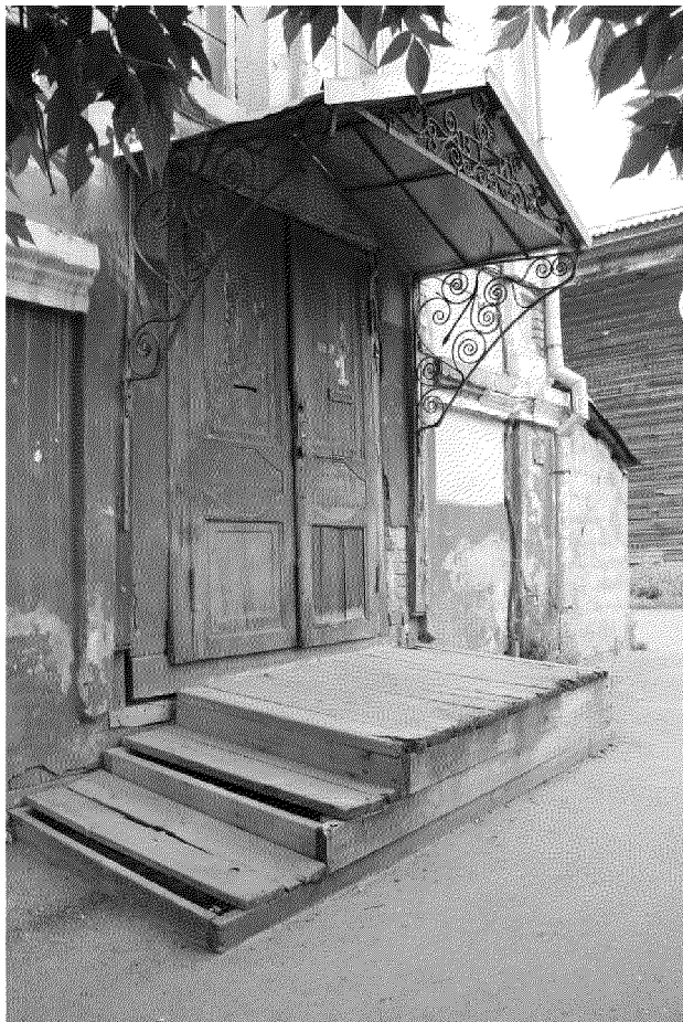
Видовая точка № 3 Парадный вход главного фасада