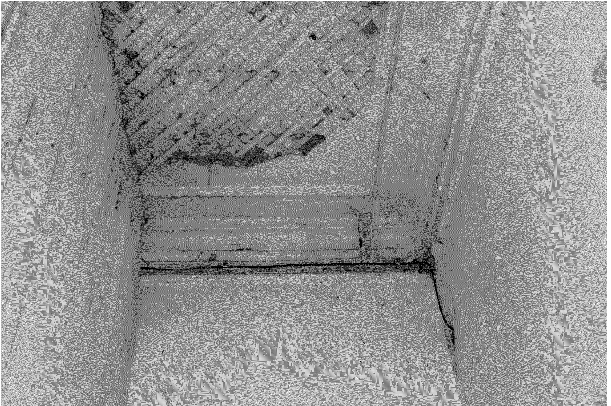
Видовая точка № 13 Профильные потолочно-стенные тяги в помещении парадной лестницы