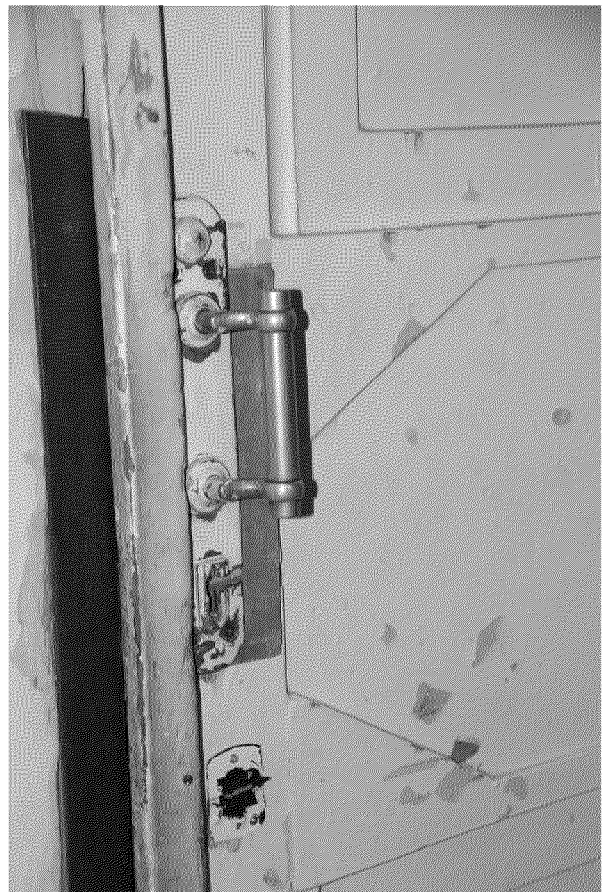
Видовая точка № 12 Дверная ручка внутренней двери