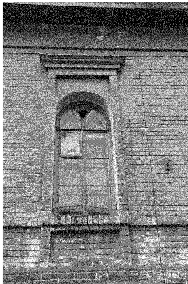
Видовая точка № 4 Окно 2-го этажа главного фасада