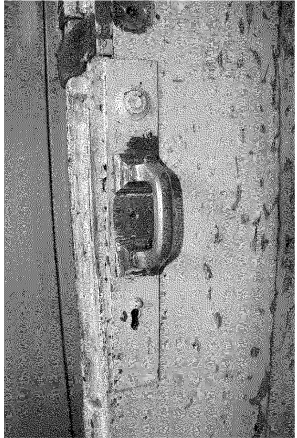
Видовая точка № 10 Дверь парадного входа. Дверная ручка