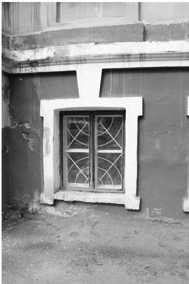
Видовая точка № 5 Окно 1-го этажа главного фасада