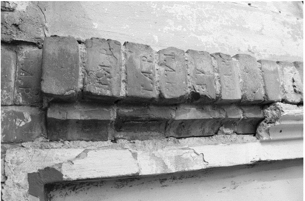
Видовая точка № 8 Фрагмент главного фасада (междуэтажный пояс). На кирпиче клеймо завода Томских арестантских рот