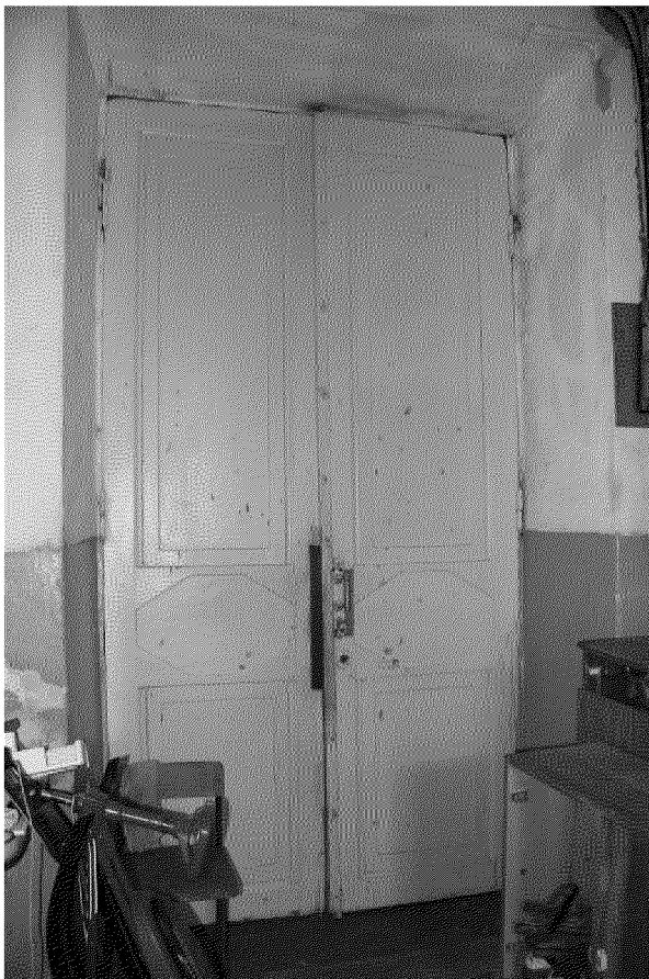
Видовая точка № 11 Внутренняя филенчатая дверь