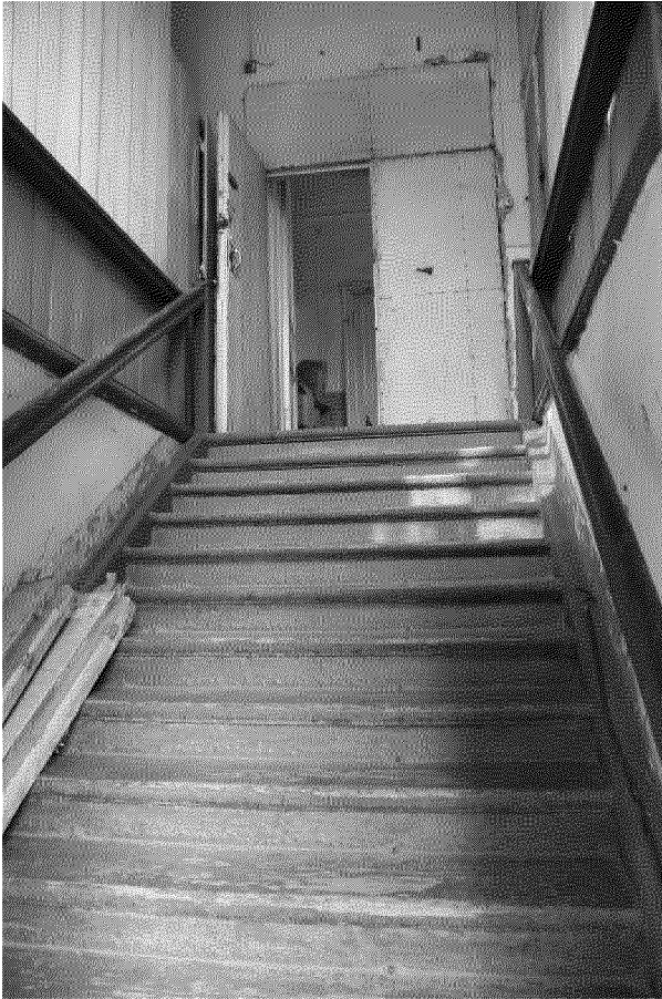
Видовая точка № 9 Деревянная парадная лестница