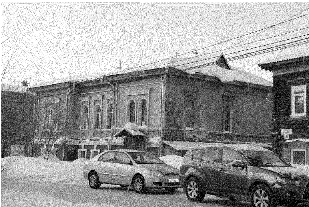
Видовая точка № 1 Общий вид здания по ул. Крылова