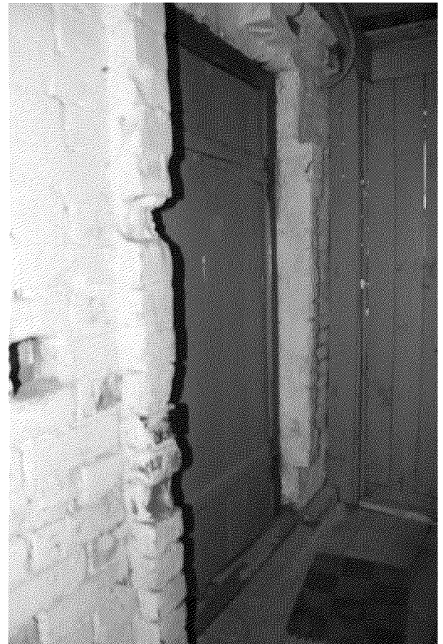
Видовая точка № 15 Деревянная дверь на шпонках и кованых навесах (1 этаж пристройки)