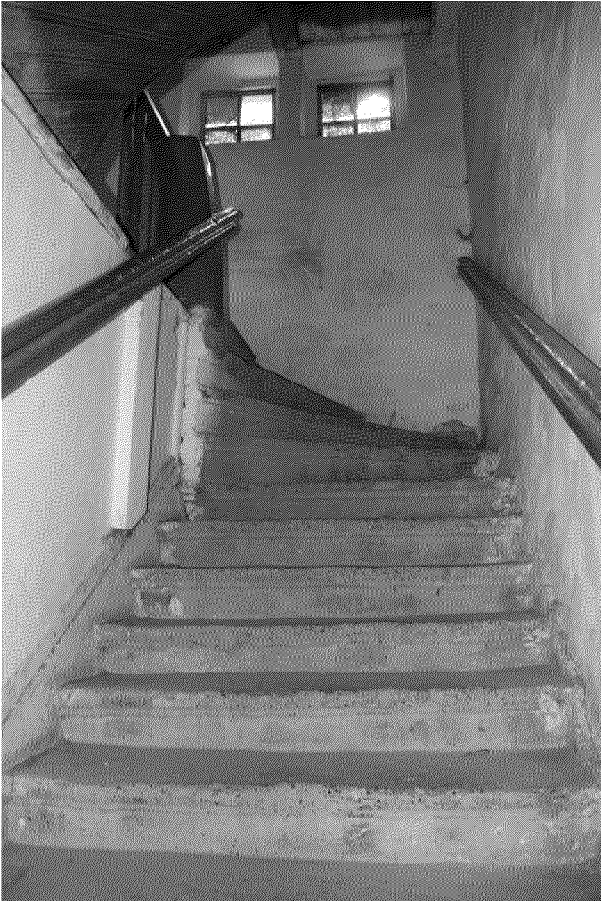
Видовая точка № 16 Пристройка. Лестница на 2-й этаж