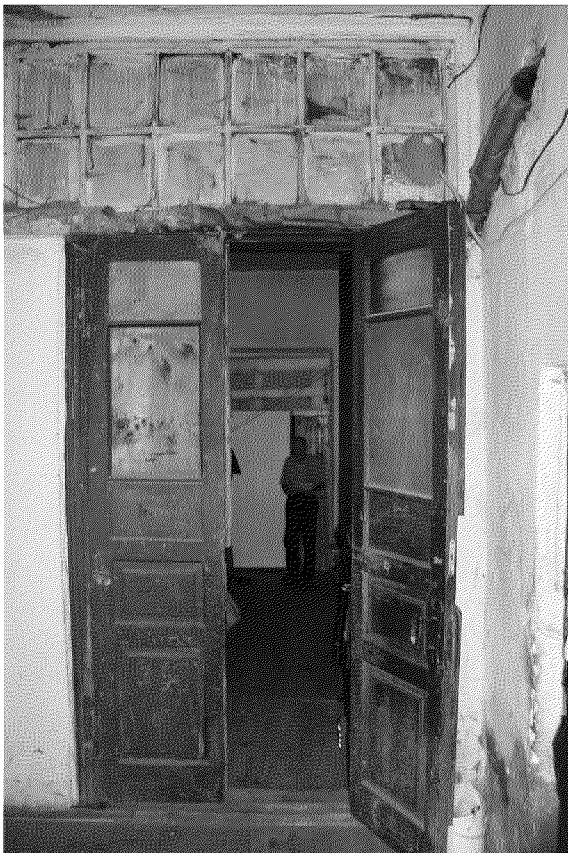
Видовая точка № 7 Деревянные филенчатые двери в коридор.