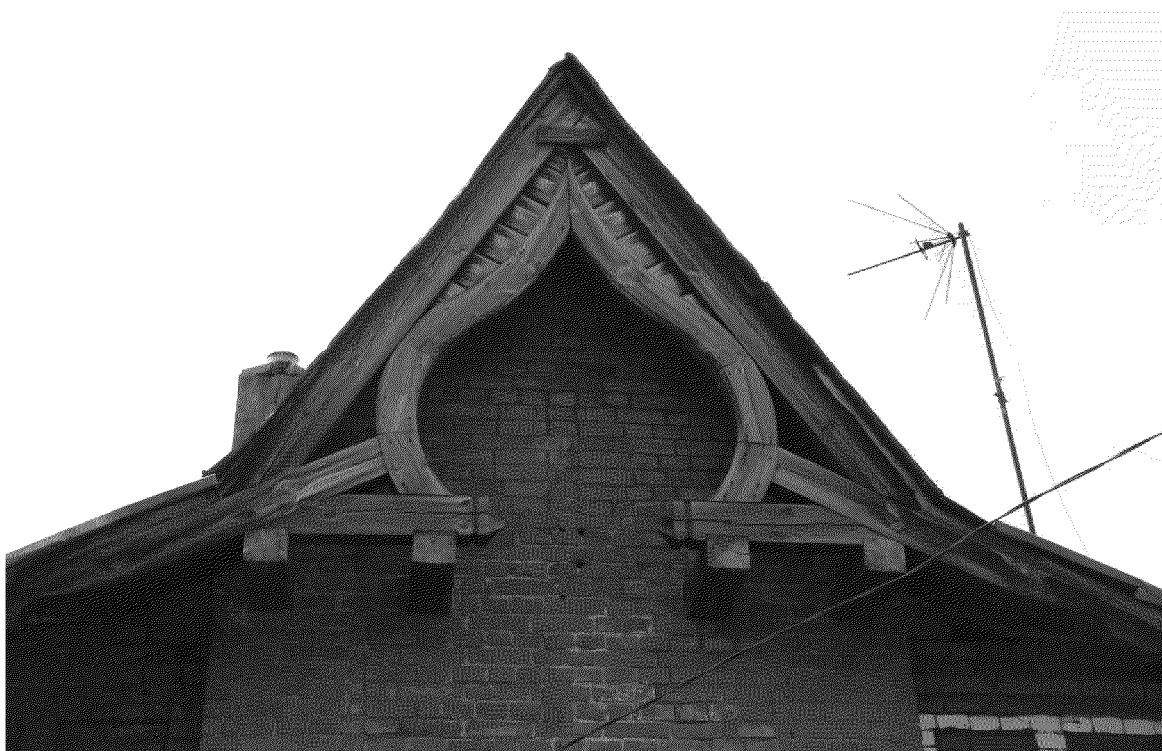
Видовая точка № 2. Щипец центрального ризалита главного фасада здания.