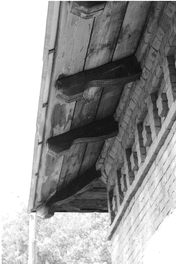
Видовая точка № 5 Фрагмент западного фасада. Карниз.