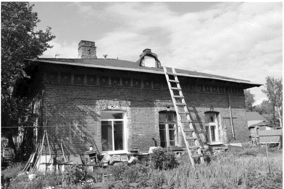
Видовая точка № 4. Южный фасад здания. Вид с территории двора.