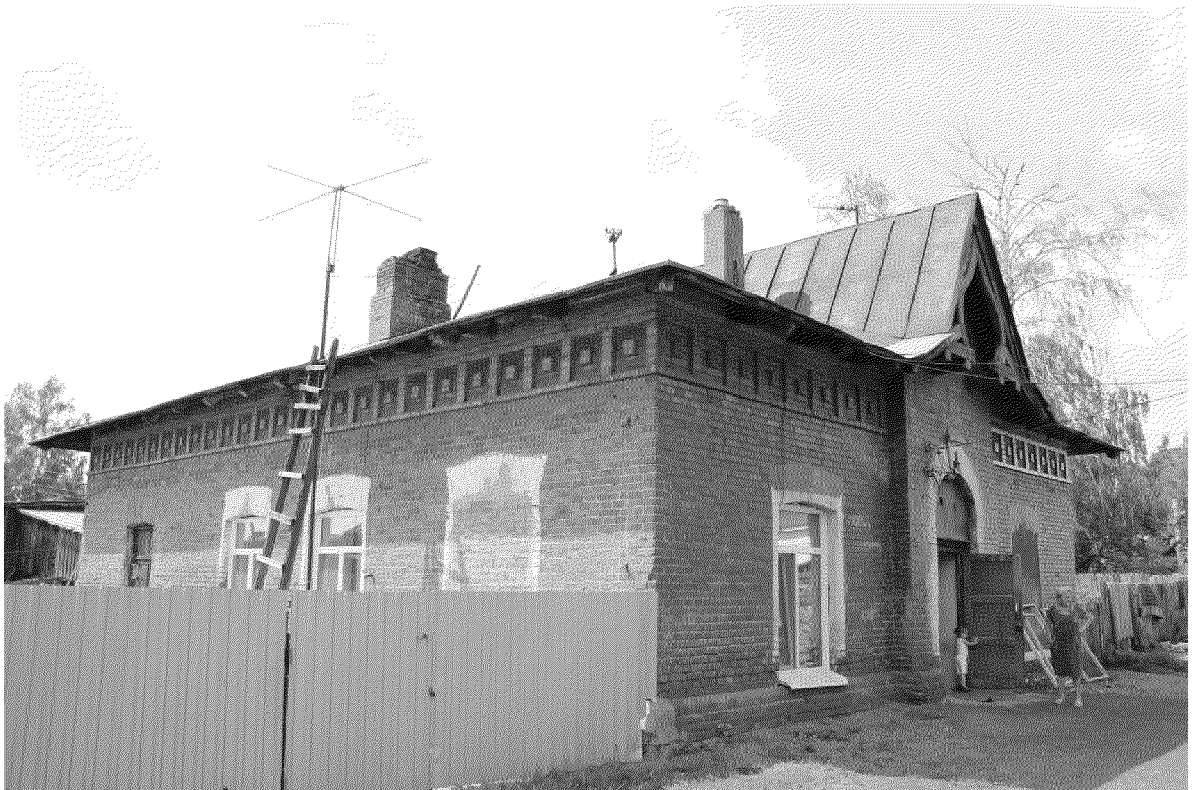
Видовая точка № 3. Общий вид здания с северо-восточной стороны. Вид со двора.