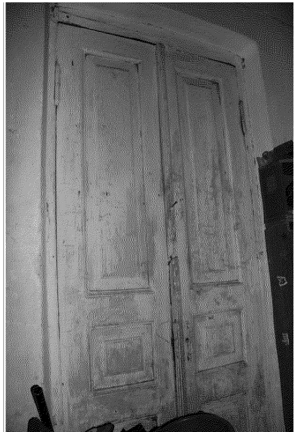
Видовая точка № 8 Внутренние филенчатые двери. Вид из коридора.