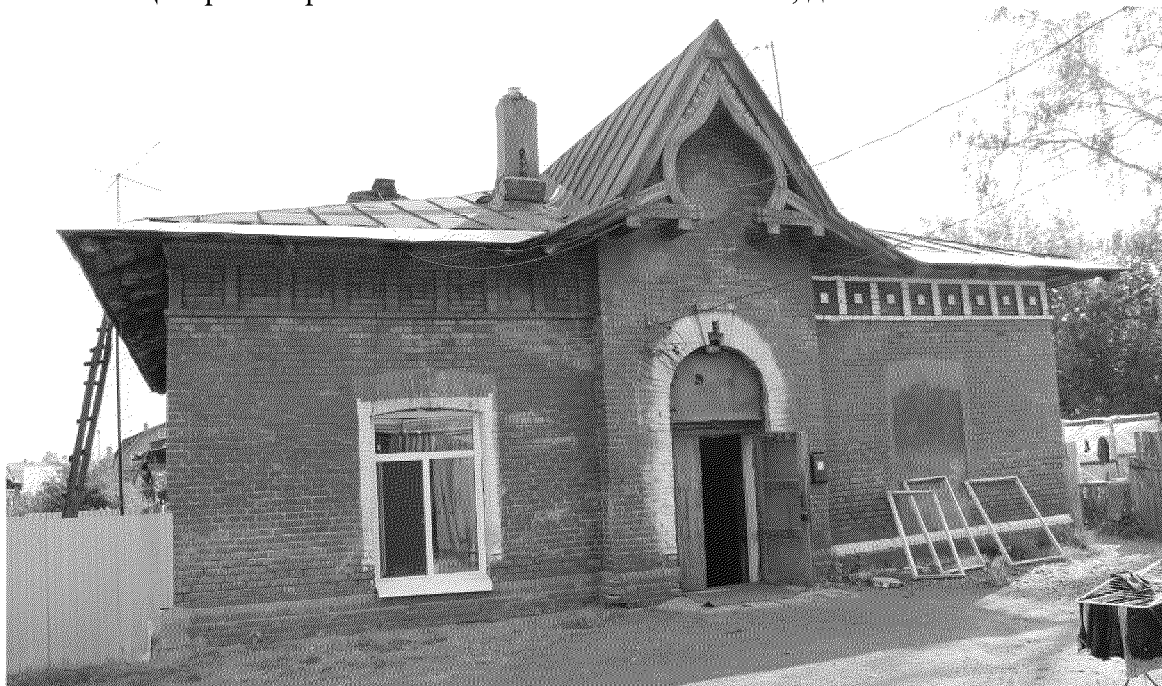
Видовая точка № 1. Главный (северный) фасад здания.

Фотографические изображения предмета охраны объекта культурного наследия регионального значения «Дом жилой для служащих», 1917 г., входящего в состав объекта культурного наследия регионального значения «Томская Окружная Психиатрическая лечебница», 1901–1915 гг., расположенного по адресу: Томская область, г. Томск, Венгерская (улица), 2 дата съемки: 15.07.2015 г.