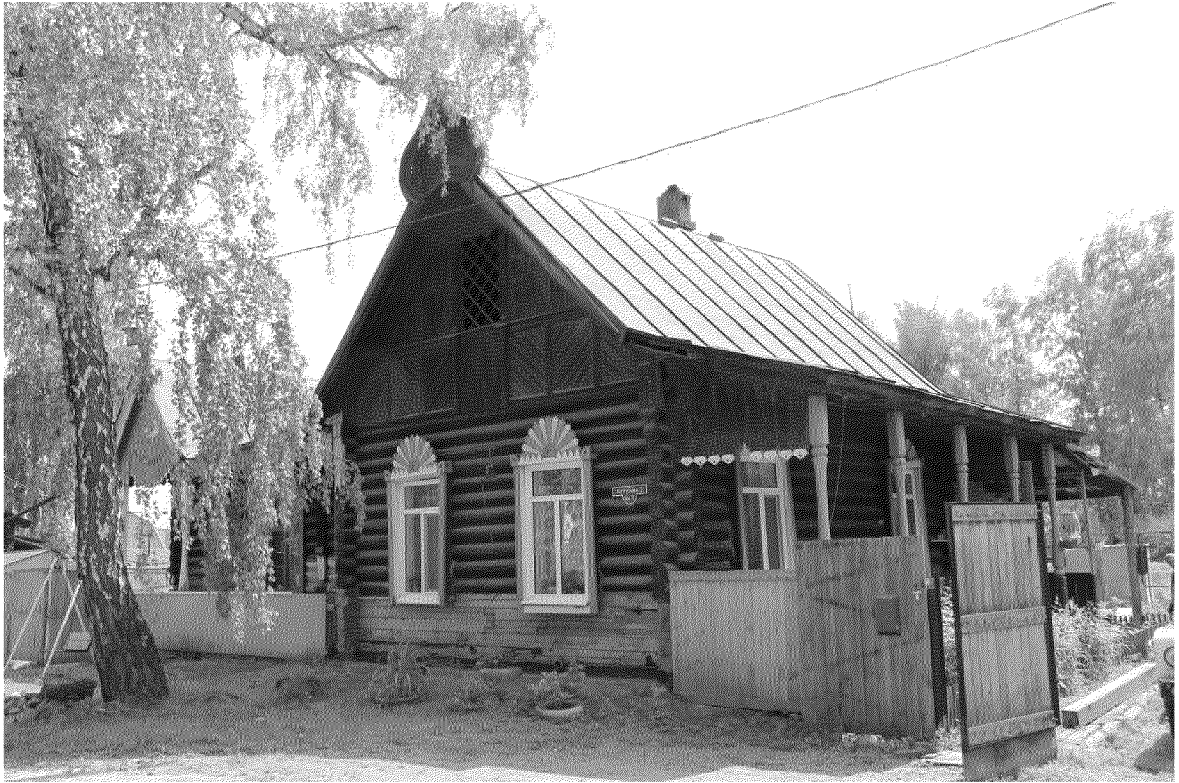
Видовая точка № 3. Общий вид здания с юго-западной стороны.