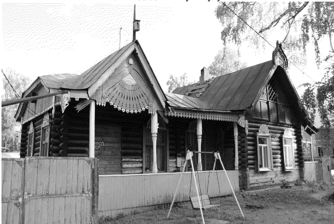
Видовая точка № 2. Главный (западный) фасад здания