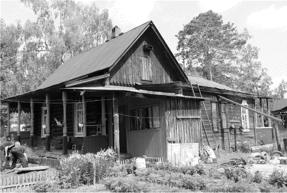
Видовая точка № 6. Общий вид здания с юго-восточной стороны (со стороны двора).