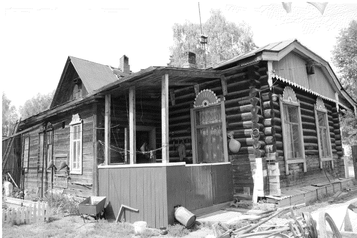
Видовая точка № 9.

Общий вид здания с северо-восточной стороны. Вид со двора.