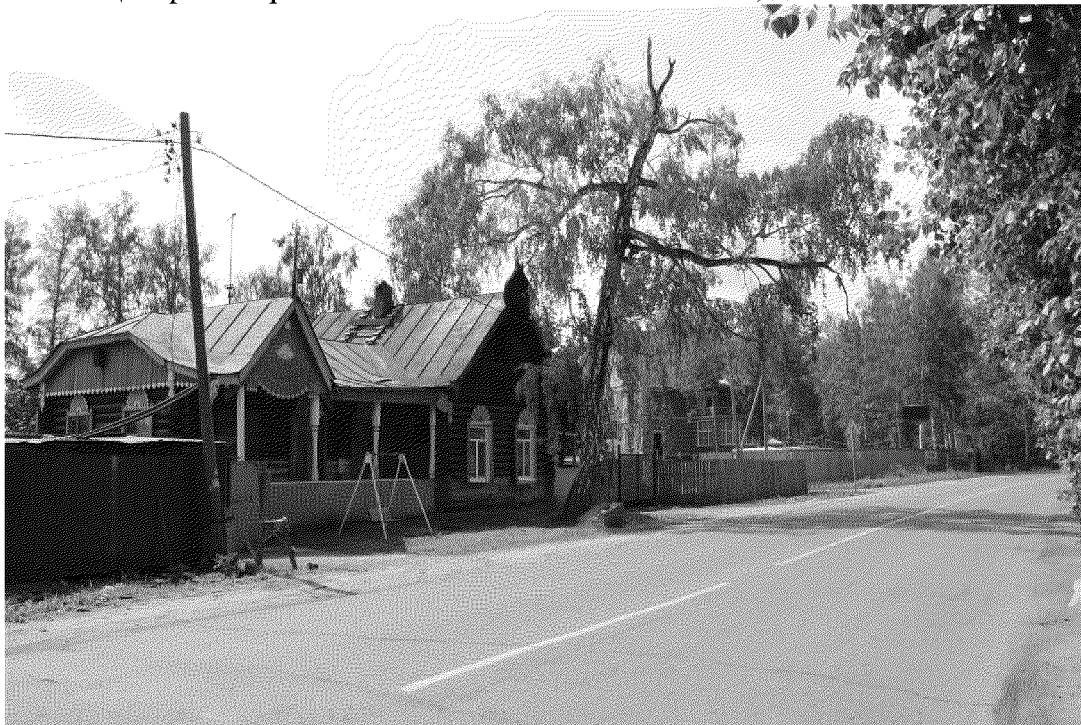
Видовая точка № 1. Общий вид здания с ул. Кутузова.

Фотографические изображения предмета охраны объекта культурного наследия регионального значения «Дом жилой для служащих», 1901–1908 гг., входящего в состав объекта культурного наследия регионального значения «Томская Окружная Психиатрическая лечебница», 1901–1915 гг., расположенного по адресу: Томская область, г. Томск, Кутузова (улица), 2. дата съемки: 14.07.2015 г.