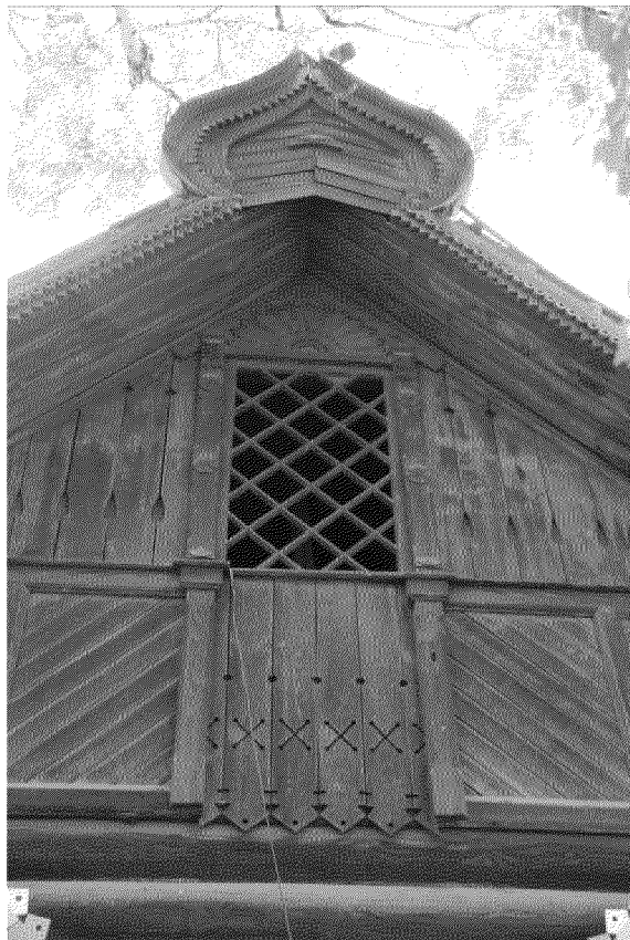
Видовая точка № 4 Фрагмент главного фасада. Декор щипца. Слуховое окно.