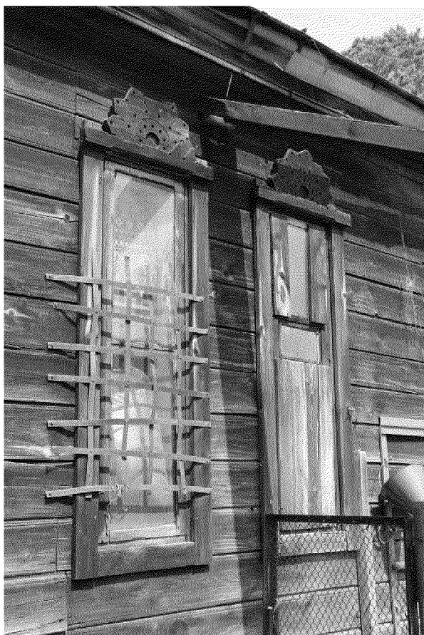
Видовая точка № 10

Общий вид здания с северо-восточной стороны. Вид со двора.