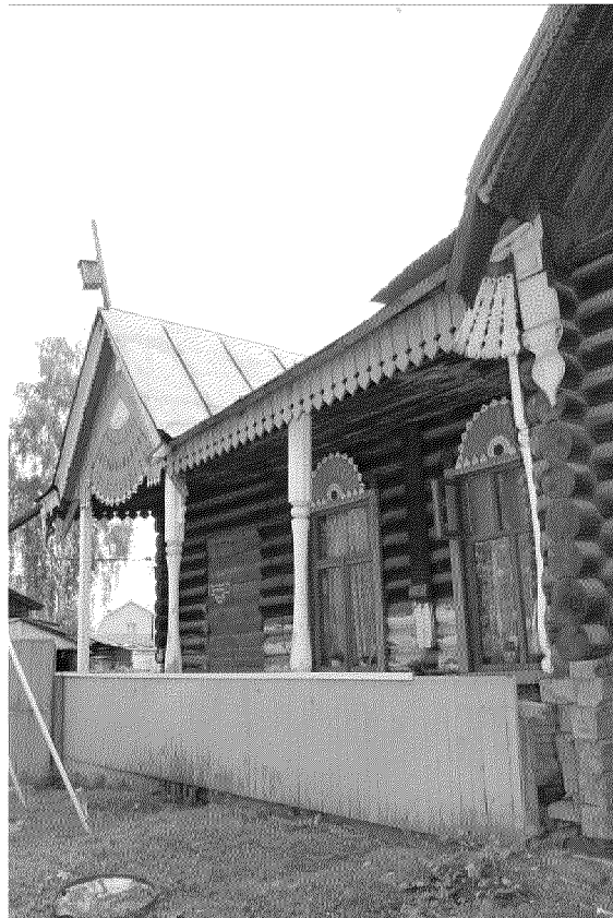
Видовая точка № 8 Терраса с навесом на фигурных столбах главного (западного) фасада.