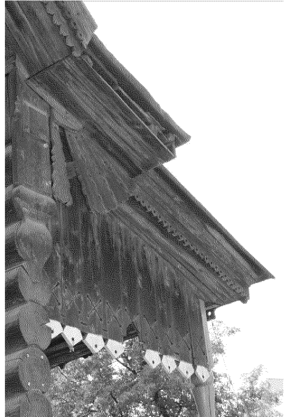
Видовая точка № 5 Фрагмент главного фасада. Декор карниза.