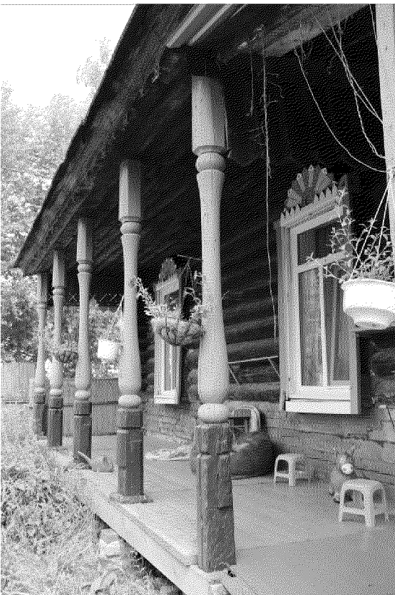
Видовая точка № 7 Терраса с навесом на фигурных столбах южного фасада здания.