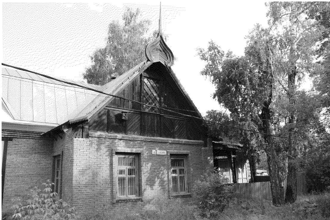
Видовая точка № 1. Общий вид здания с ул. Кутузова.

дата съемки: 15.07.2015 г.