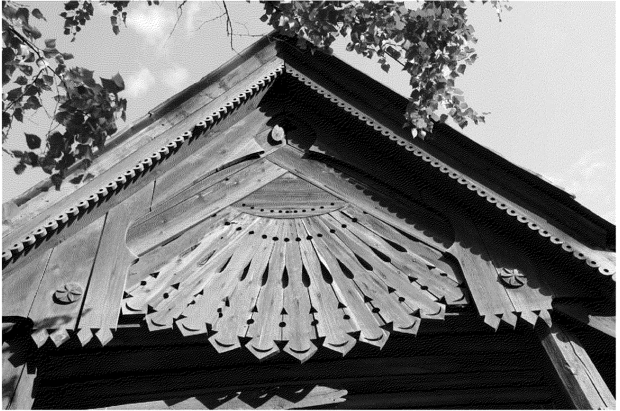
Видовая точка № 9. Фрагмент декоративного оформления щипца главного фасада