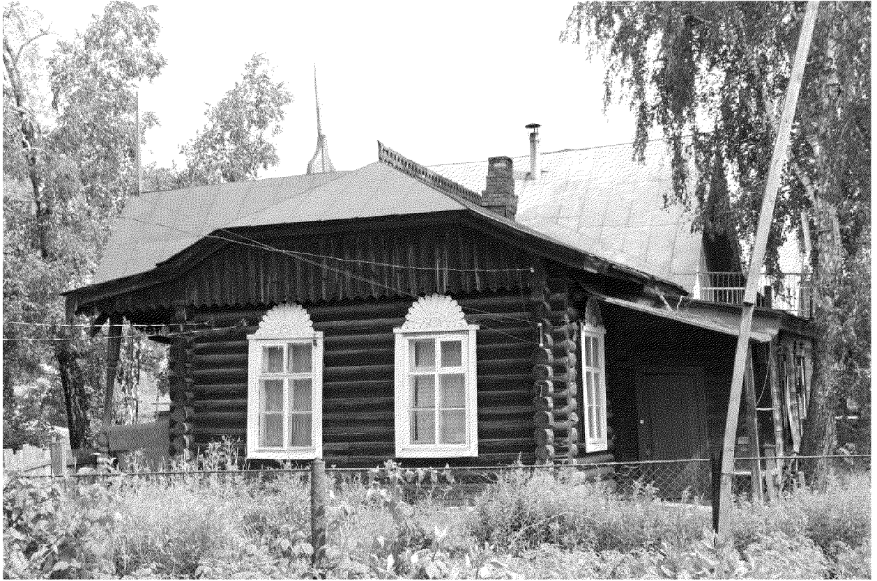
Видовая точка № 3. Южный фасад здания. Вид со стороны соседней усадьбы.