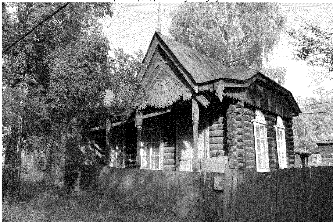
Видовая точка № 2. Общий вид здания с юго-западной стороны. Вид с ул. Кутузова.