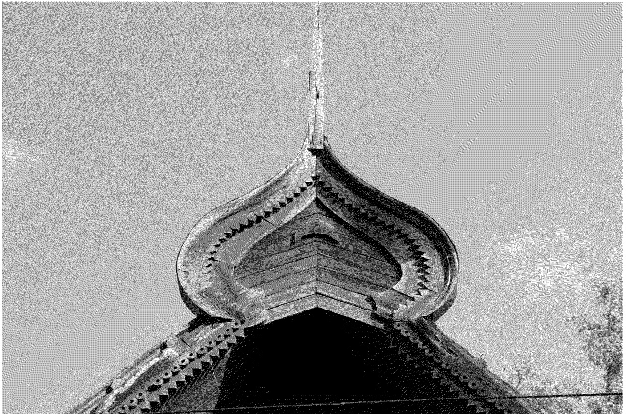
Видовая точка № 6. Фрагмент декоративного оформления щипца главного фасада.