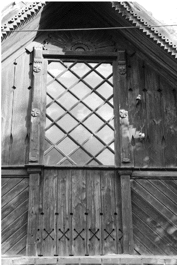
Видовая точка № 4 Фрагмент декоративного оформления щипца главного фасада.