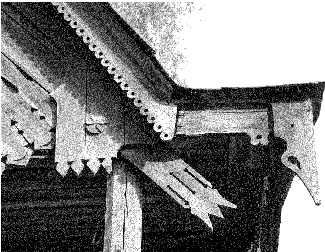
Видовая точка № 10. Фрагмент декоративного оформления карниза и свеса крыши террасы.