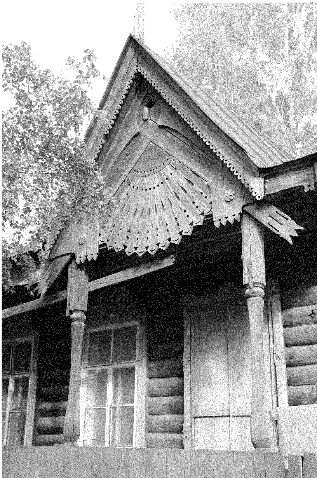
Видовая точка № 8. Терраса с навесом на столбах главного фасада.