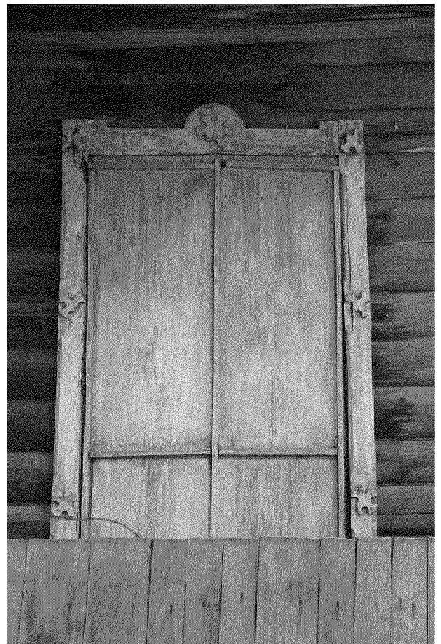
Видовая точка № 5 Наличник окна главного фасада (со стороны террасы).