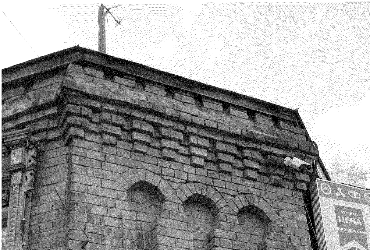
Видовая точка № 7. Фрагмент восточного фасада. Карниз. (Олейник А.Ю., 2019 г.)