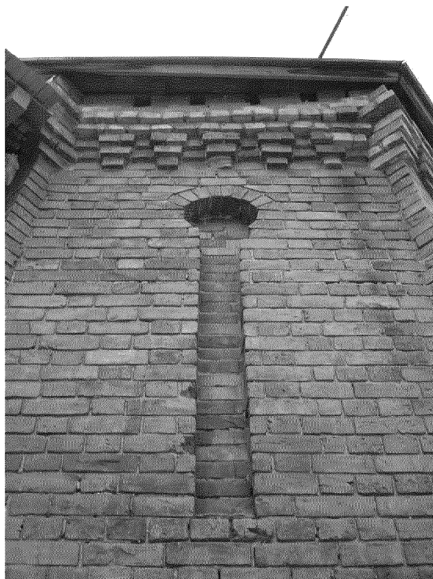
Видовая точка № 8. Окно (ниша) юго-западного фасада (Рыжикова А.Ю., 2016 г.)