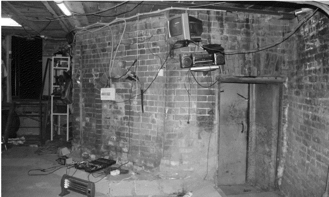
Видовая точка № 10. Вид башни из помещения пристройки. (Рыжикова А.Ю., 2016 г.)