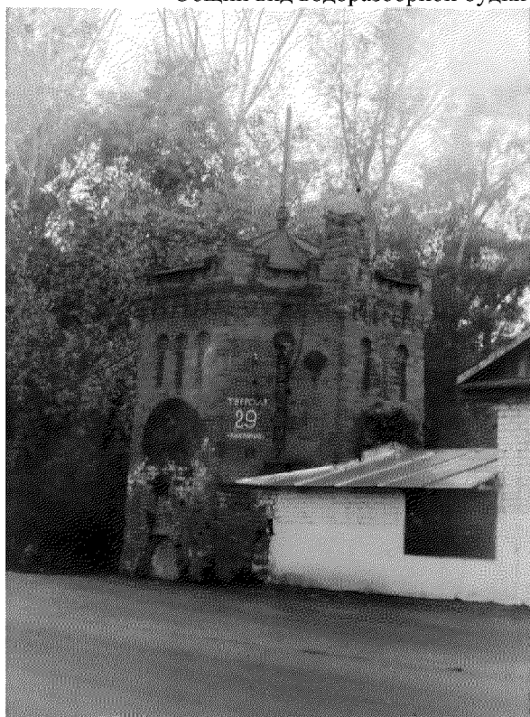
Видовая точка № 2.

Общий вид водоразборной будки с ул. Тверской (Олейник А.Ю., 2018 г.)