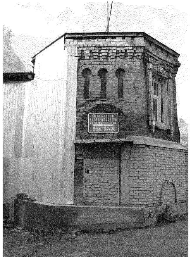
Видовая точка № 6. Южный фасад (Олейник А.Ю., 2018 г.)