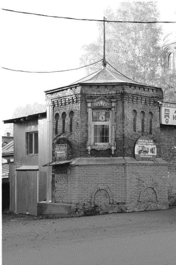
Видовая точка № 5. Вид будки с юго-восточной стороны (Олейник А.Ю., 2018 г.)