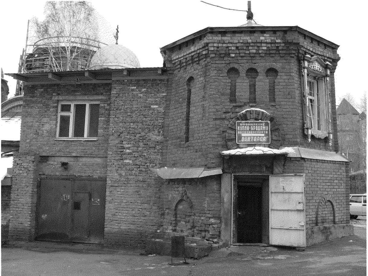
Видовая точка № 4. Южный фасад (2011 г.).