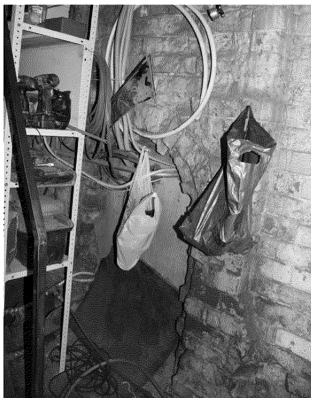
Видовая точка № 12. Окно северного фасада вид из помещения пристройки