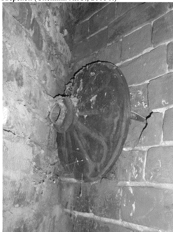
Видовая точка № 3.

Вид будки с северо-восточной стороны (2000-е гг.)