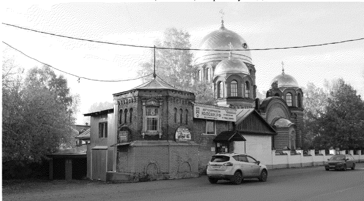
Видовая точка № 1.

Фотографические изображения предмета охраны объекта культурного наследия регионального значения «Водоразборная будка», 1904 г., входящая в состав объекта культурного наследия регионального значения «Ансамбль инженерных сооружений Общества механических заводов Братьев Бромлей», 1904-1905 гг., расположенного по адресу: Томская область, г. Томск, Тверская улица, 25б