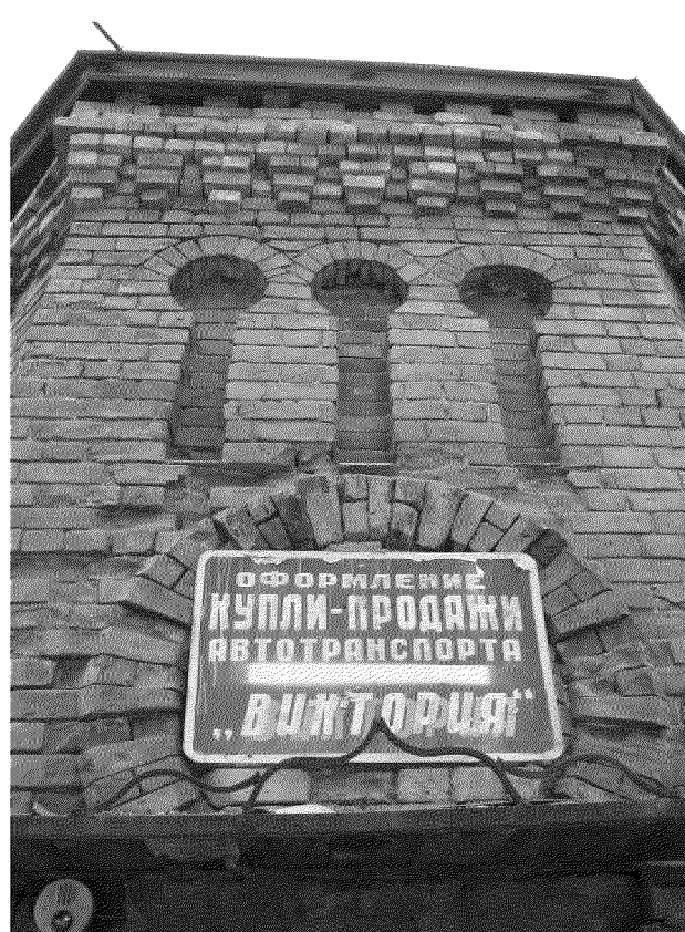
Видовая точка № 9. Фрагмент южного фасада (Рыжикова А.Ю., 2016 г.)