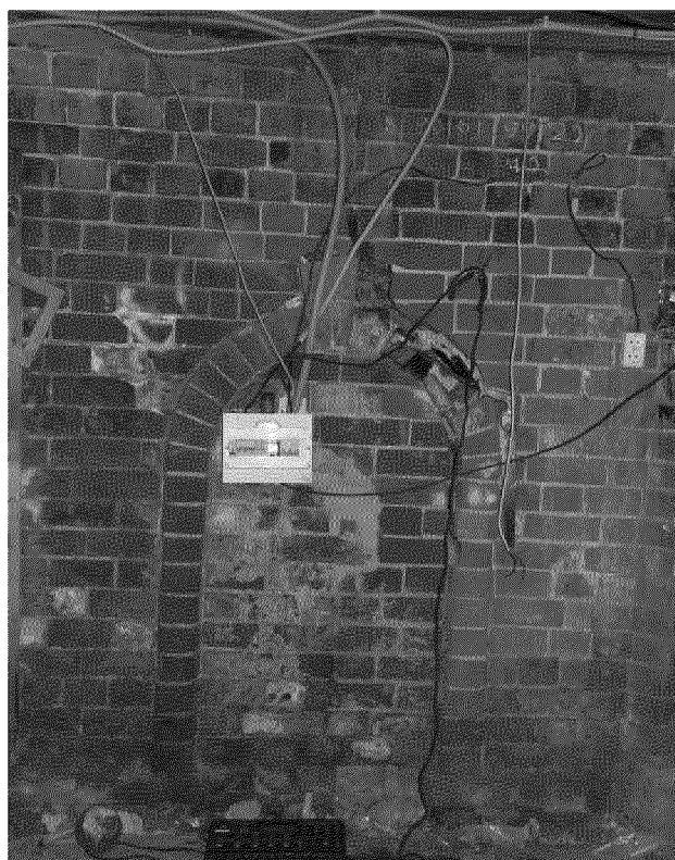
Видовая точка № 11. Окно (ниша) (Рыжикова А.Ю., 2016 г.)