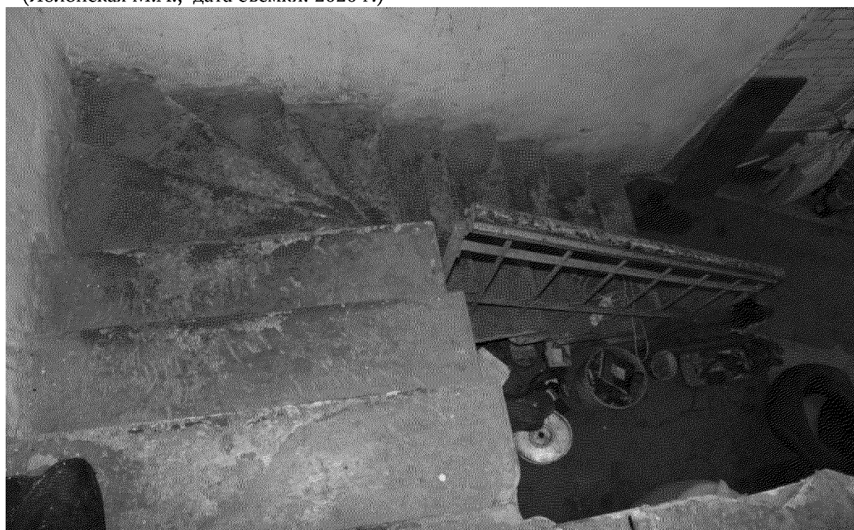
Видовая точка № 24.

«Черная» П-образная лестница с забежными ступенями и кованым ограждением (Яблонская М.А., дата съемки: 2020 г.)