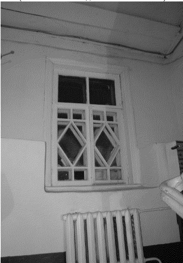
Видовая точка № 19. Витражная расстекловка оконного проема центрального ризалита. Вид с лестничной площадки (дата съемки: 2014 г.)