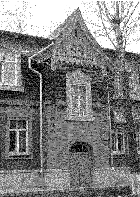
Видовая точка № 9. Центральный ризалит восточного фасада (дата съемки: 2014 г.)