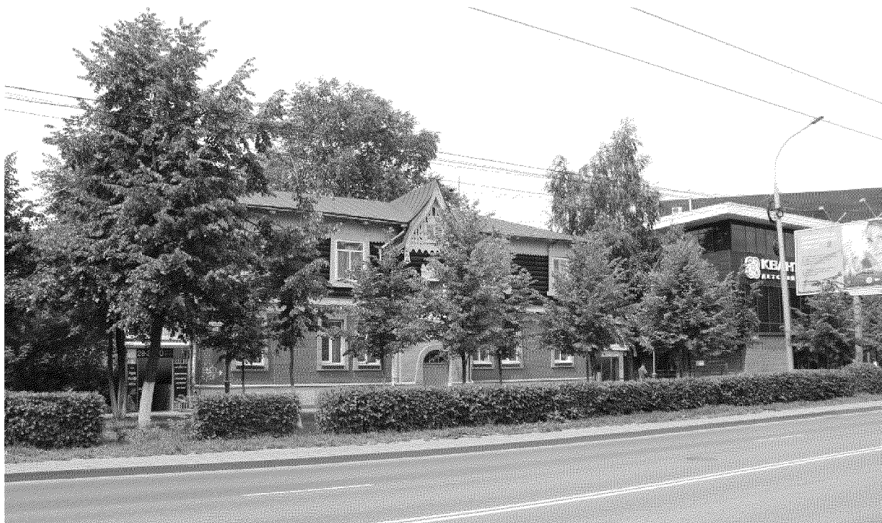
Видовая точка №1

Панорама застройки проспекта Ленина (дата: 25.06.2020 г.)