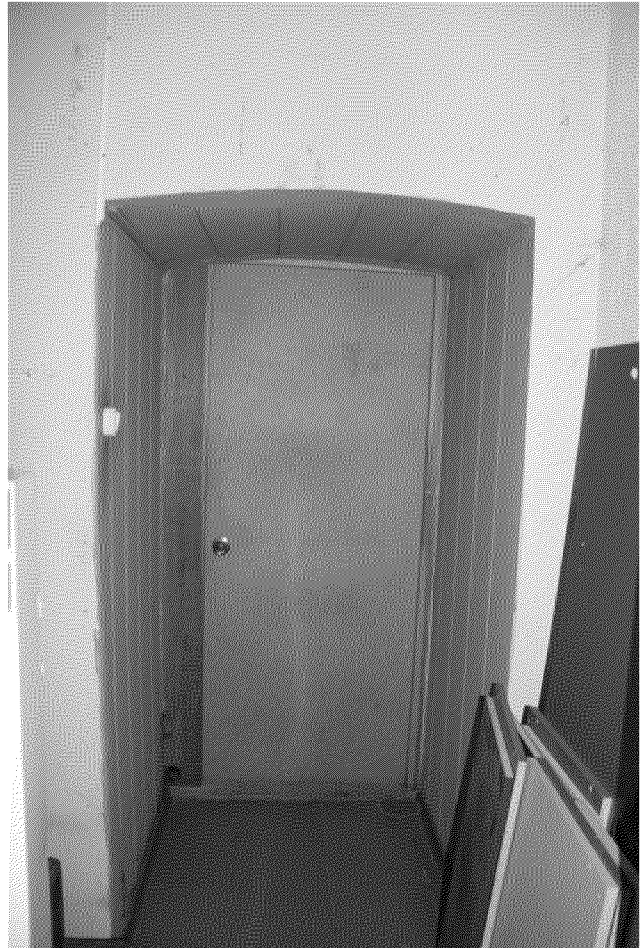
Видовая точка № 26. Лучковый дверной проем помещения подвала (Яблонская М.А., дата съемки: 2020 г.)