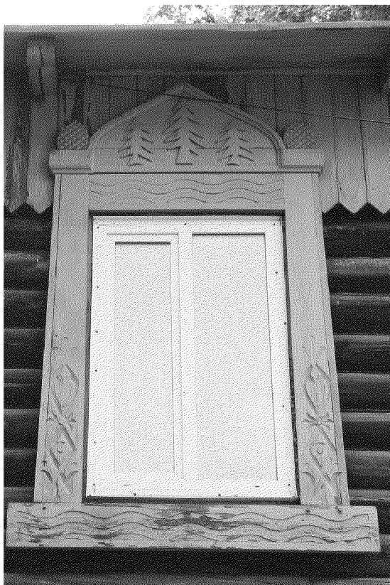
Видовая точка № 11. Наличник окна 2-го этажа северного фасада. (Горбань К. Е., дата съемки: 2020 г.)