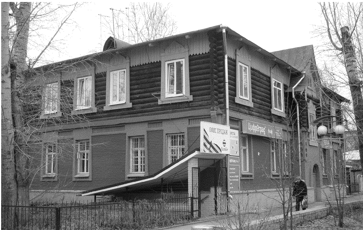
Видовая точка № 3. Общий вид здания с юго-восточной стороны. Вид с пр. Ленина (дата съемки: 2016 г.)