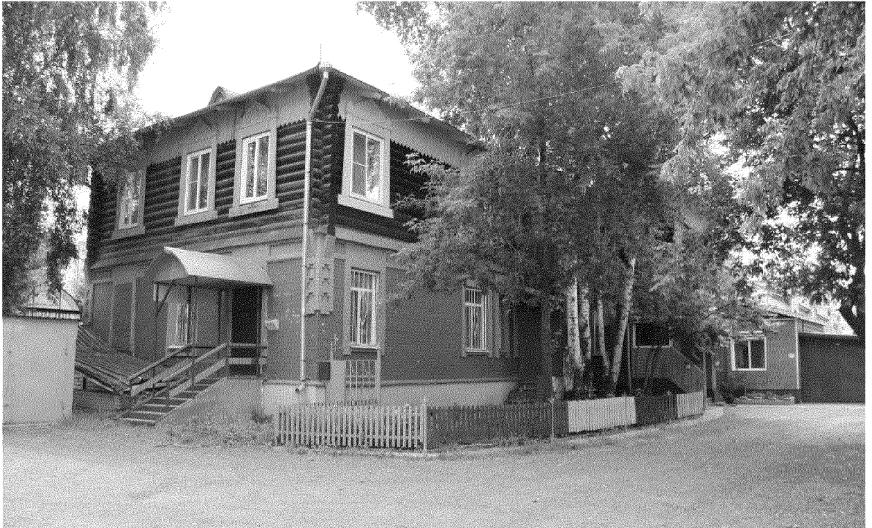
Видовая точка № 5

Общий вид здания с северо-западной стороны. Вид с внутри дворовой территории (дата съемки: 25.06.2020 г.)