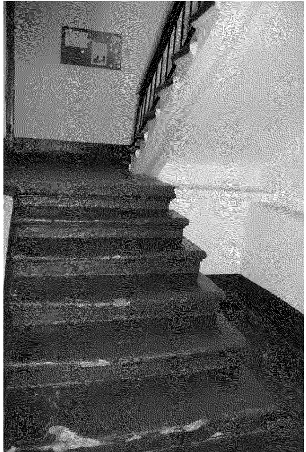
Видовая точка № 18. Парадная двух маршевая лестница