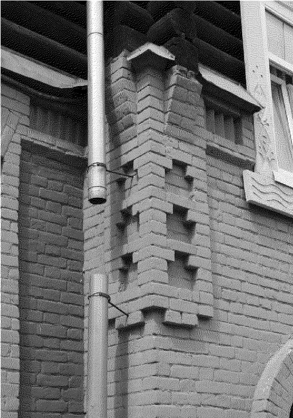
Видовая точка № 13. Угловые лопатки, оформленные фигурными ширинками и консолями (дата съемки: 2014 г.)