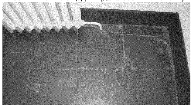
Видовая точка № 21. Плиты песчаника в покрытии пола лестничной площадки парадной лестницы (дата съемки: 2020 г.)