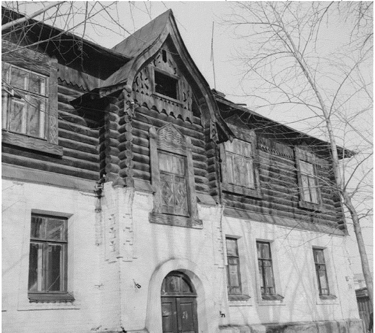
Видовая точка № 30. Восточный фасад. Историческая расстеловка заполнения оконных проемов