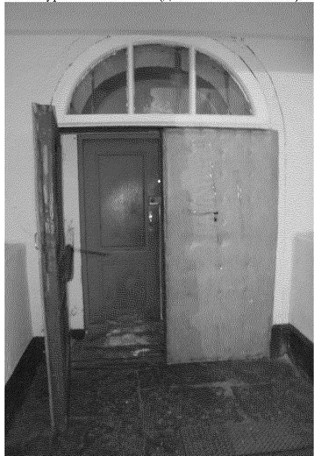
Видовая точка № 16. Двойные двери парадного входа с остекленной фрамугой (дата съемки: 2014 г.)