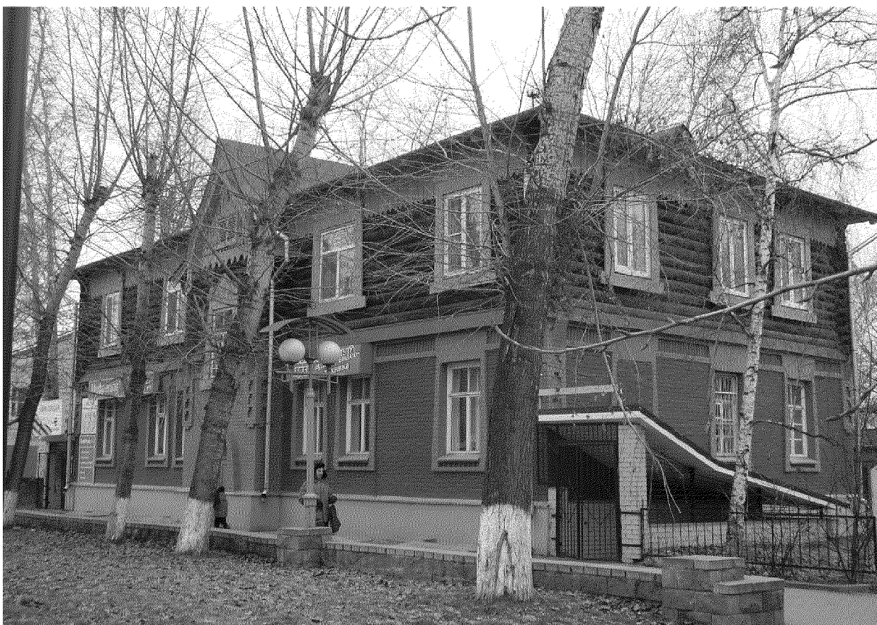
Видовая точка № 4 Общий вид здания с северо-восточной стороны. Вид с пр. Ленина (дата съемки: 2016 г.)