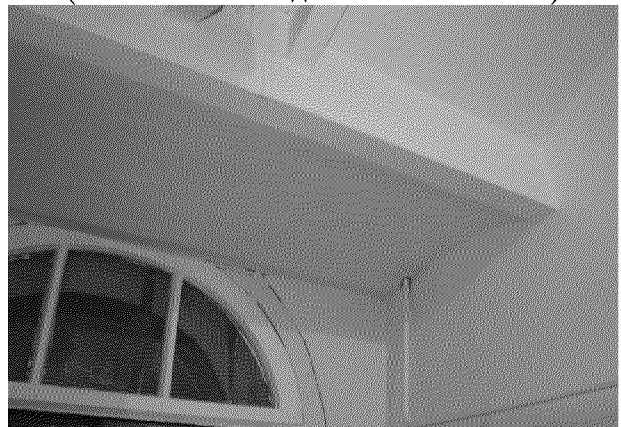
Видовая точка № 20. Кирпичный свод по металлическим балкам лестничной площадки (дата съемки: 2020 г.)