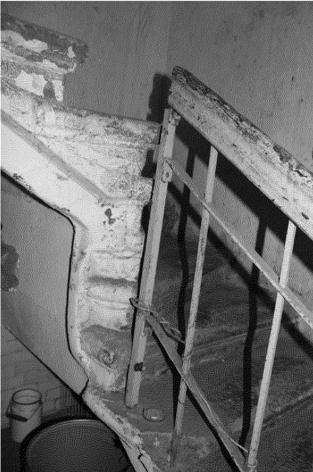
Видовая точка № 25. Фрагмент кованого ограждения лестницы (Яблонская М.А., дата съемки: 2020 г.)