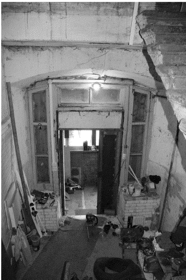
Видовая точка № 22.

Лучковый дверной проем выхода во двор, дверная коробка с импостами, остекленной фрамугой и двумя узкими боковыми окнами (Яблонская М.А., дата съемки: 2020 г.)