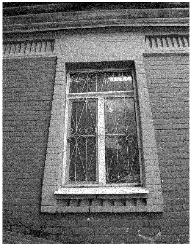
Видовая точка № 12. Окно 1-го этажа северного фасада. (Горбань К. Е., дата съемки: 2020 г.)