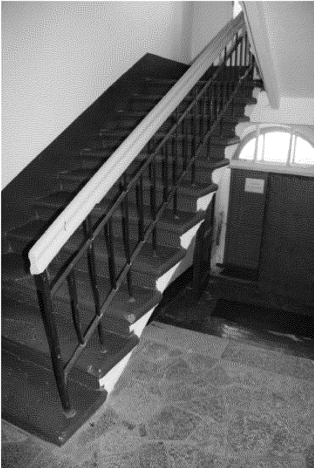
Видовая точка № 17. Парадная двух маршевая лестница (Яблонская М.А. дата съемки: 2020 г.)