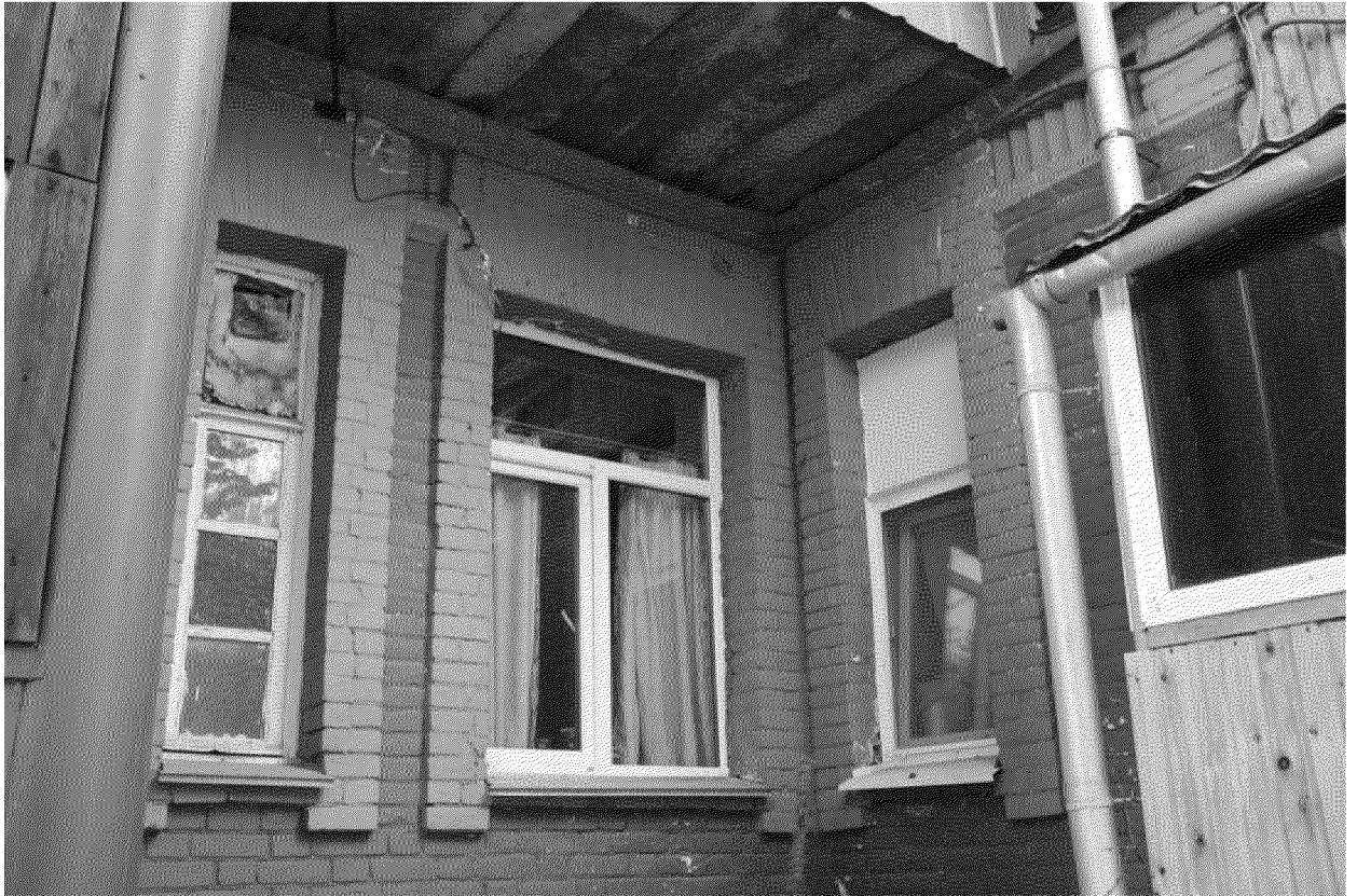
Видовая точка № 7.

Окна 1-го этажа. Фрагмент западного фасада, вид с внутри дворовой территории (дата съемки: 03.07.2020 г.)