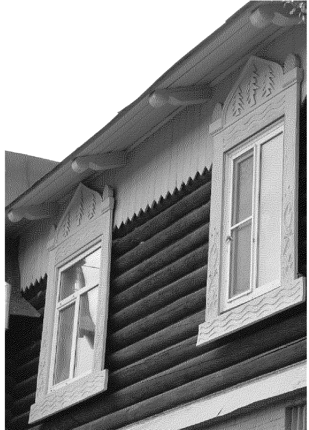
Видовая точка № 14. Фрагмент карниза главного фасада. Фигурные кобылки (дата съемки: 2020 г.)