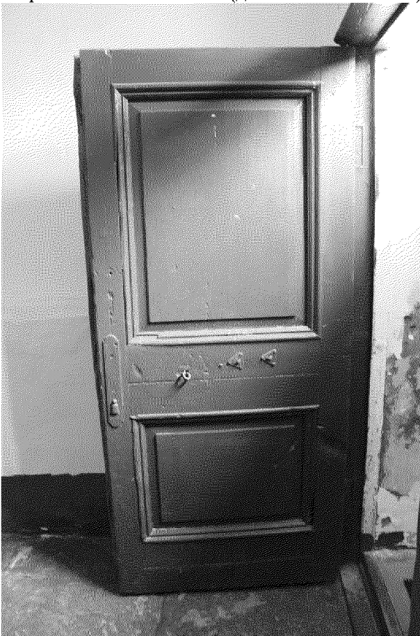
Видовая точка № 15. Деревянные филенчатые двери главного входа (Горбань К. Е., дата съемки: 2020 г.)