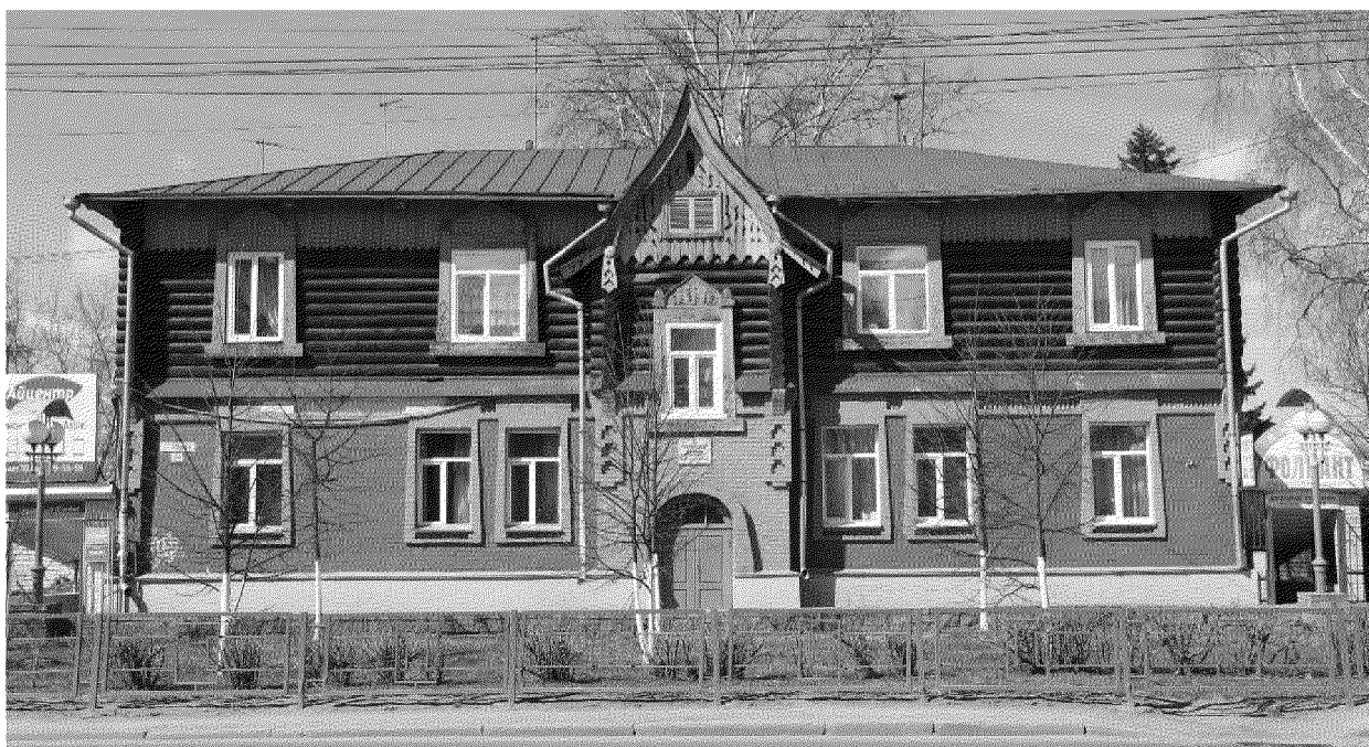
Видовая точка № 2

Панорама застройки проспекта Ленина (дата: 25.06.2020 г.)