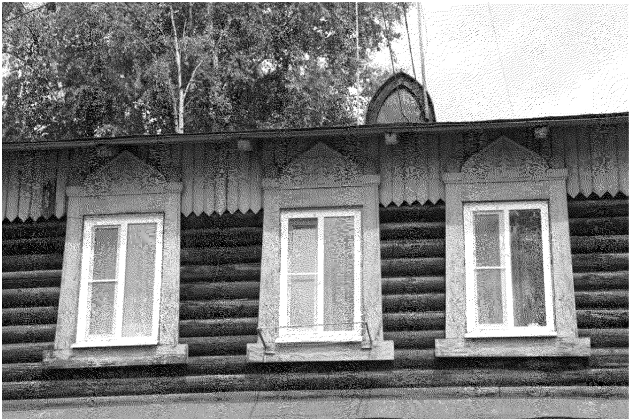
Видовая точка № 8.

Окна 1-го этажа. Фрагмент западного фасада, вид с внутри дворовой территории (автор снимка: Яблонская М.А., дата съемки: 03.07.2020 г.)