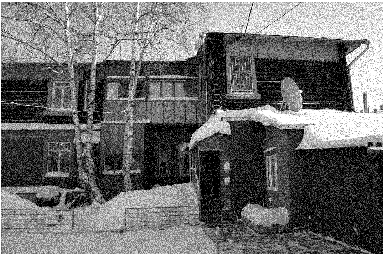
Видовая точка № 6.

Общий вид здания с северо-западной стороны. Вид с внутри дворовой территории (автор снимка: Горбань К. Е., дата съемки: 25.06.2020 г.)