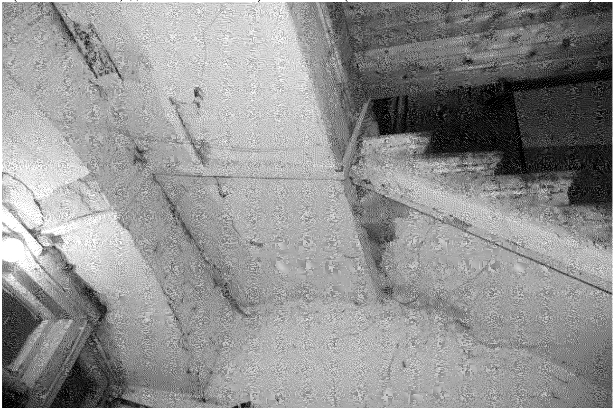
Видовая точка № 27. Кирпичный свод по металлическим балкам лестничной площадки (Яблонская М.А., дата съемки: 2020 г.)