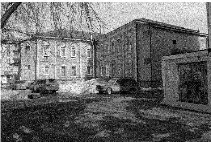
Видовая точка № 2. Общий вид здания с юго-западной стороны (дворовые фасады здания)

Общий вид здания с пр. Ленина (угловое расположение здания в квартале).