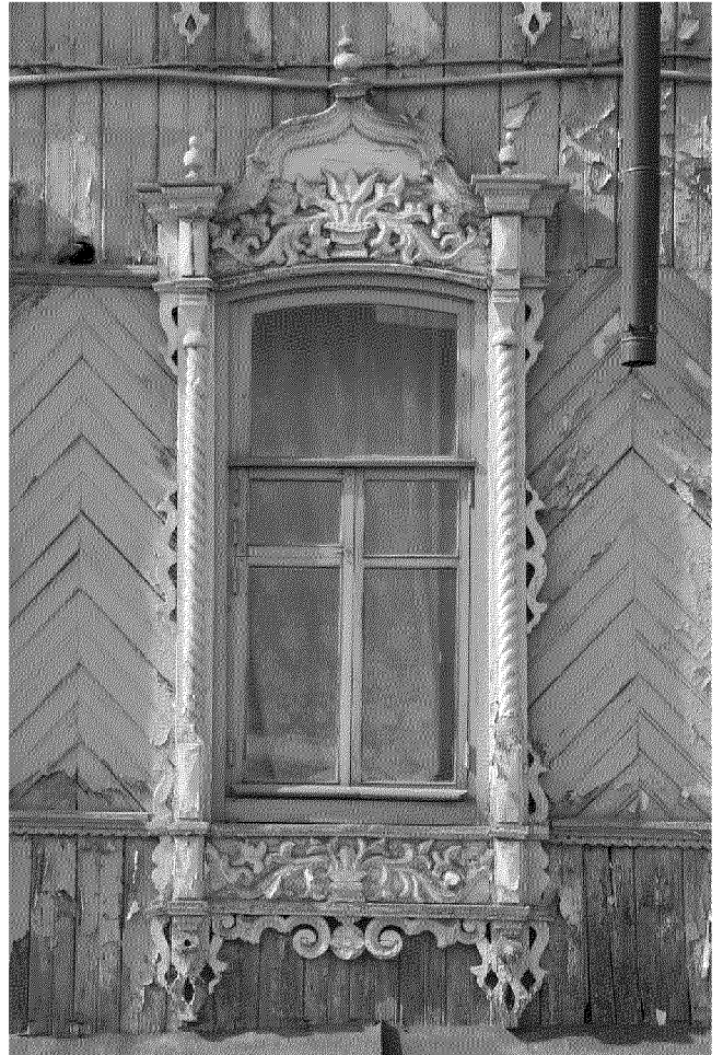
Видовая точка № 7. Окно 1-го этажа восточного фасада здания