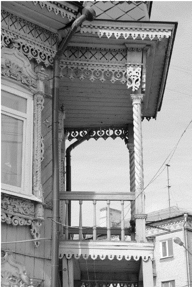
Видовая точка № 8. Угловой балкон