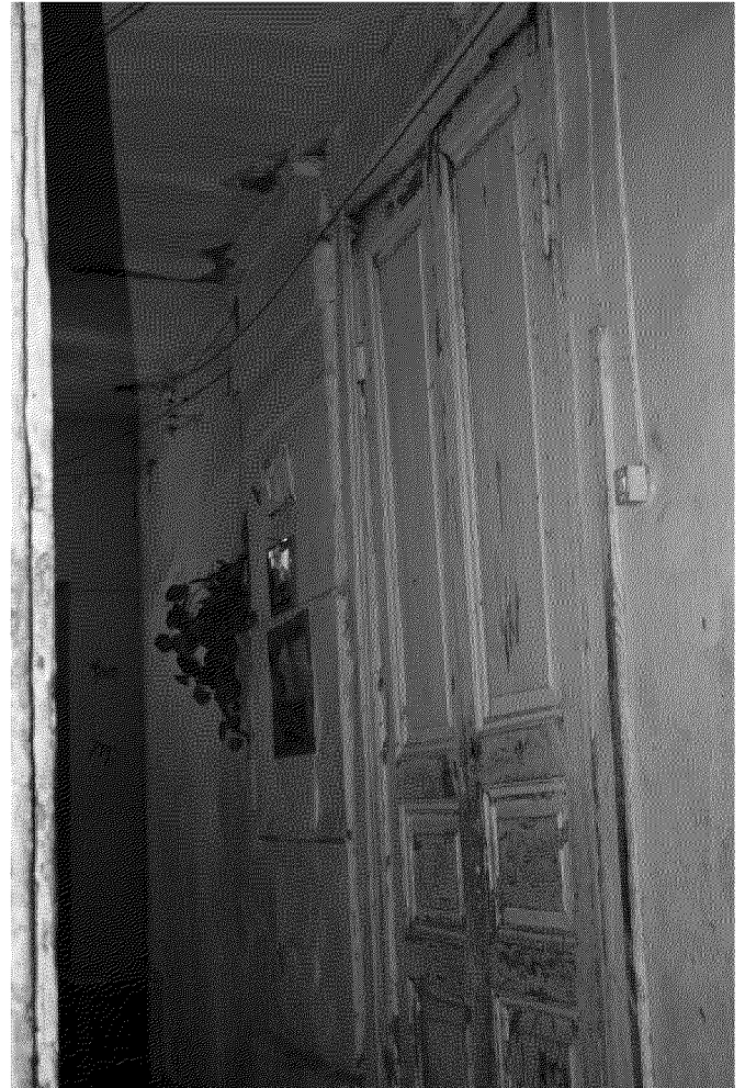
Видовая точка № 11. Фрагмент интерьера (Фишко М.В., 2013 г.)