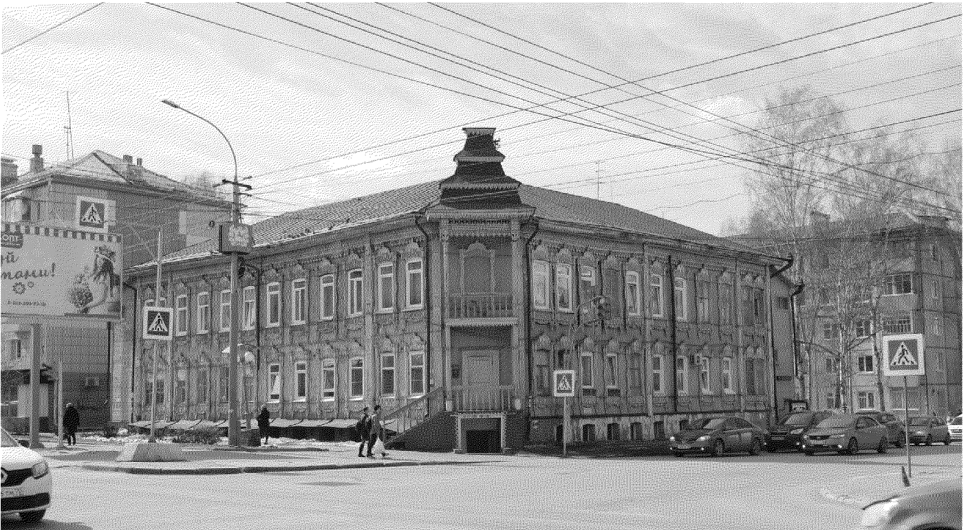
Видовая точка № 1.

дата съемки: 02.04.2019 г.