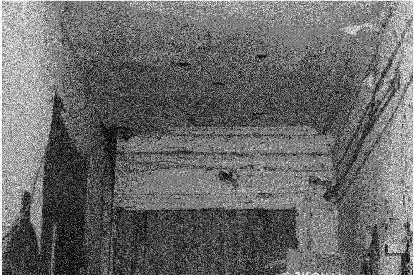
Видовая точка № 13.

Профильные штукатурные тяги в отделке потолка коридора