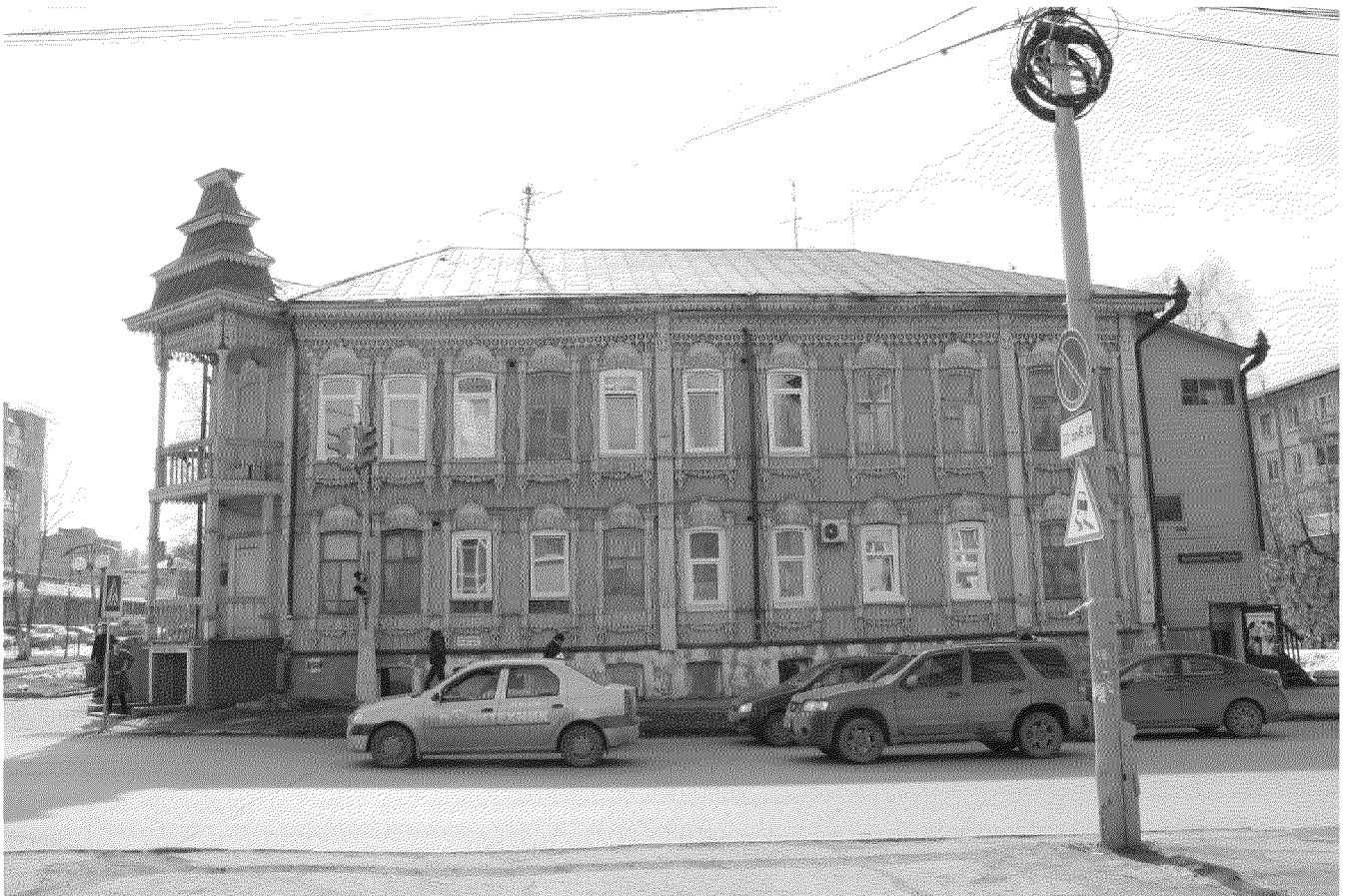
Видовая точка № 5. Северный фасад здания, вид с ул. Учебной