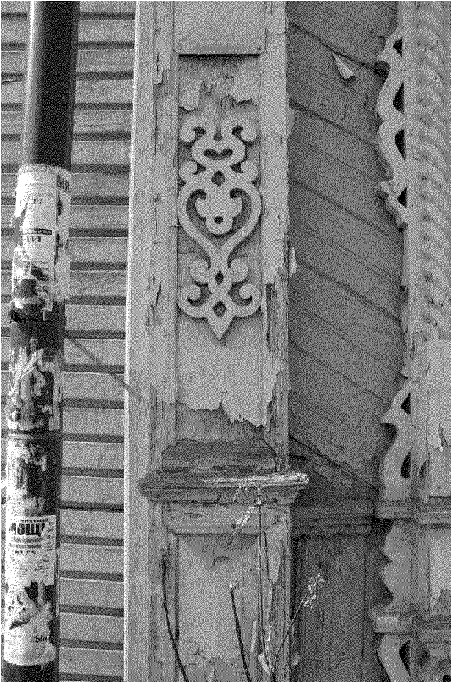
Видовая точка № 10. Фрагмент пилястры восточного фасада