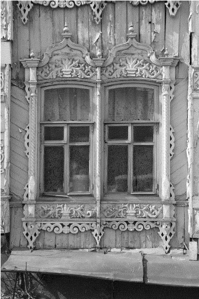
Видовая точка № 6. Сдвоенное окно 1-го этажа восточного фасада здания