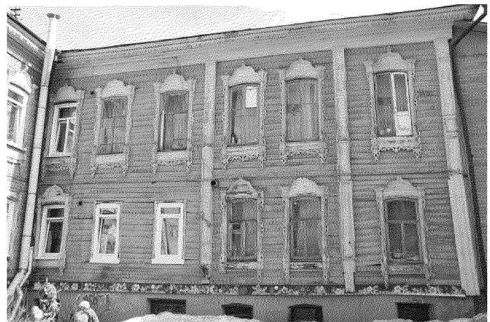
Видовая точка № 3. Фрагмент западного фасада здания