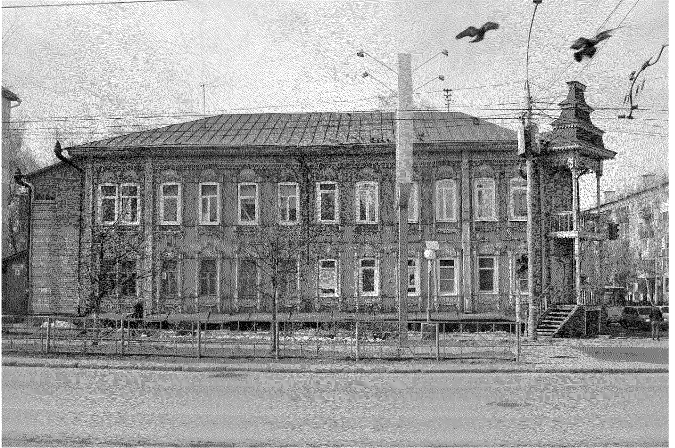
Видовая точка № 4. Восточный фасад здания, вид с пр. Ленина