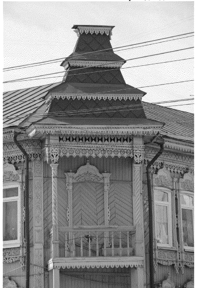
Видовая точка № 9. Угловой балкон с шатровым завершением