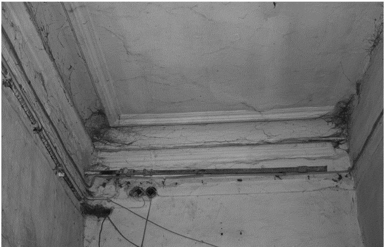
Видовая точка № 12. Профильные штукатурные тяги в отделке потолка коридора