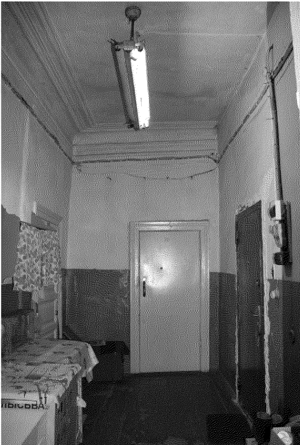
Видовая точка № 10.

Профильные потолочно-стенные штукатурные тяги (фото: Яблонской М.А., 2015 г.)