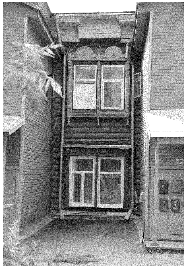
Видовая точка № 8. Перестроенная центральная часть дворового фасада с фрагментами первоначальной конфигурации карниза