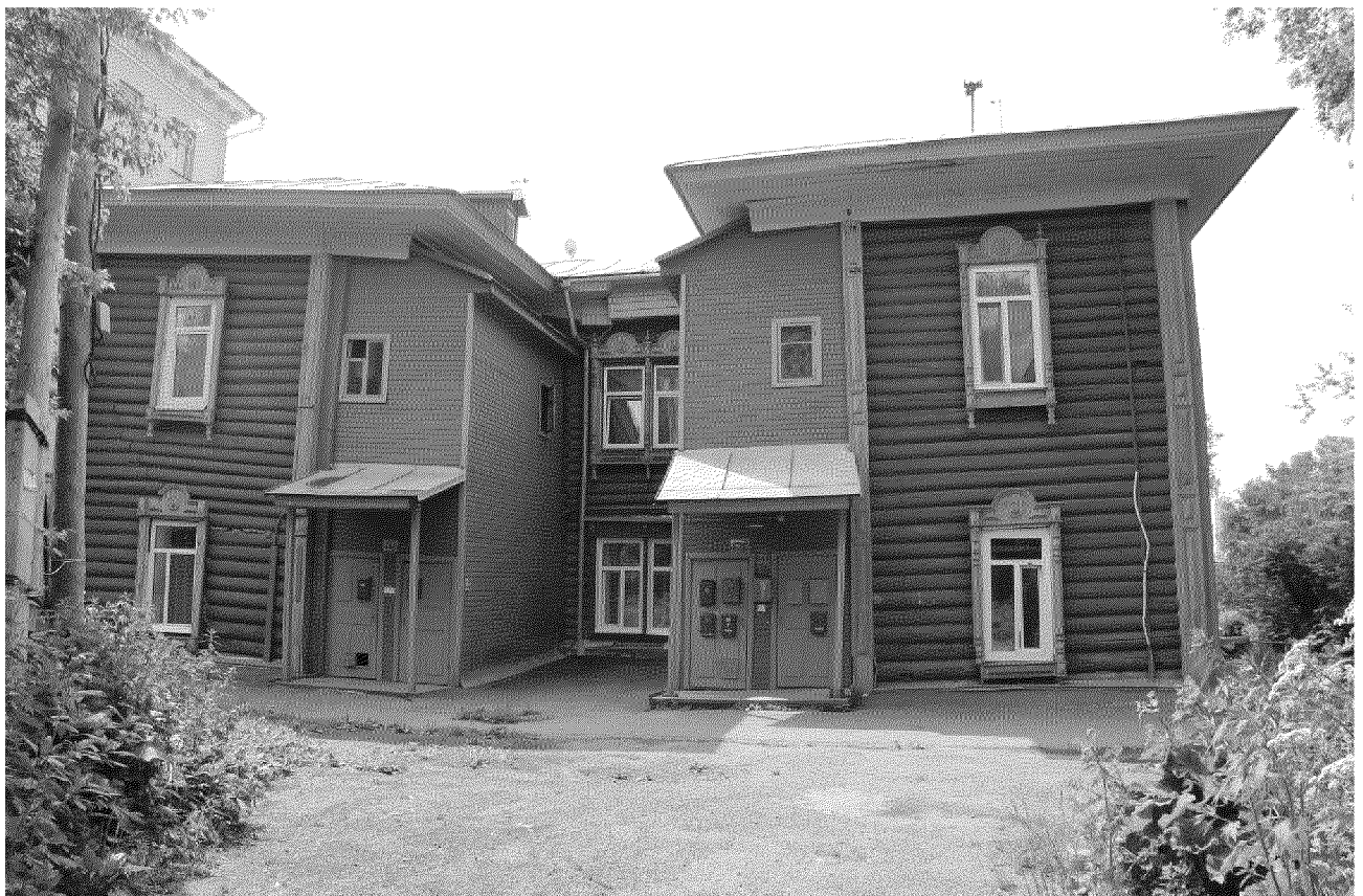
Видовая точка № 5. Дворовый (восточный) фасад здания с двумя боковыми ризалитами