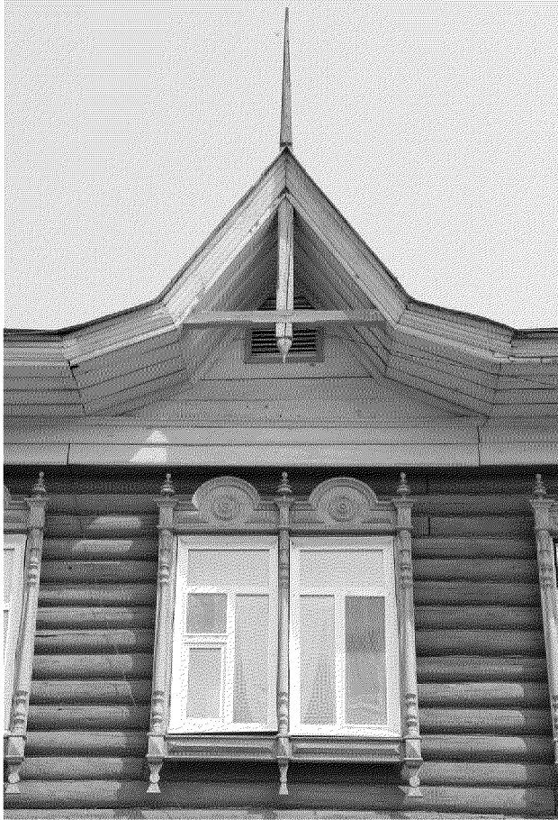
Видовая точка № 3. Сдвоенные окна 2-го этажа и треугольный щипец главного фасада