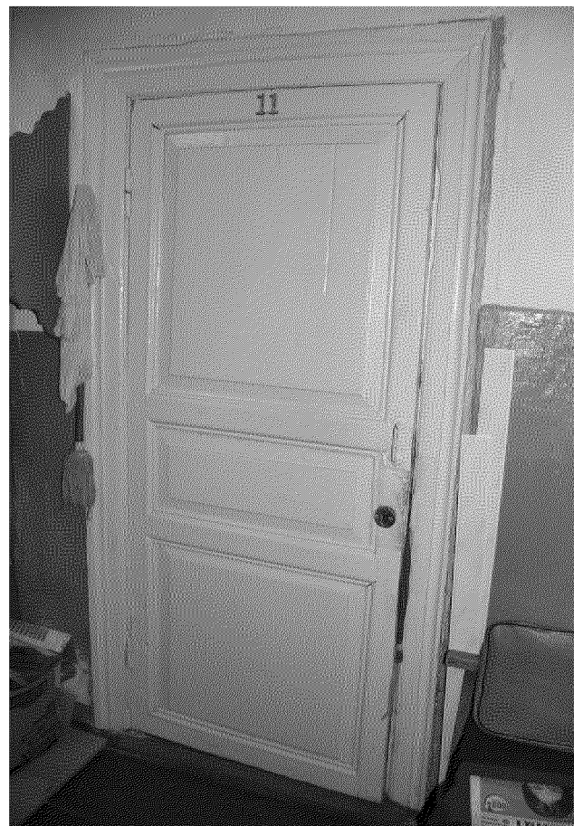
Видовая точка № 11.

Коридор 2-го этажа с фрагментами штукатурного декора потолка