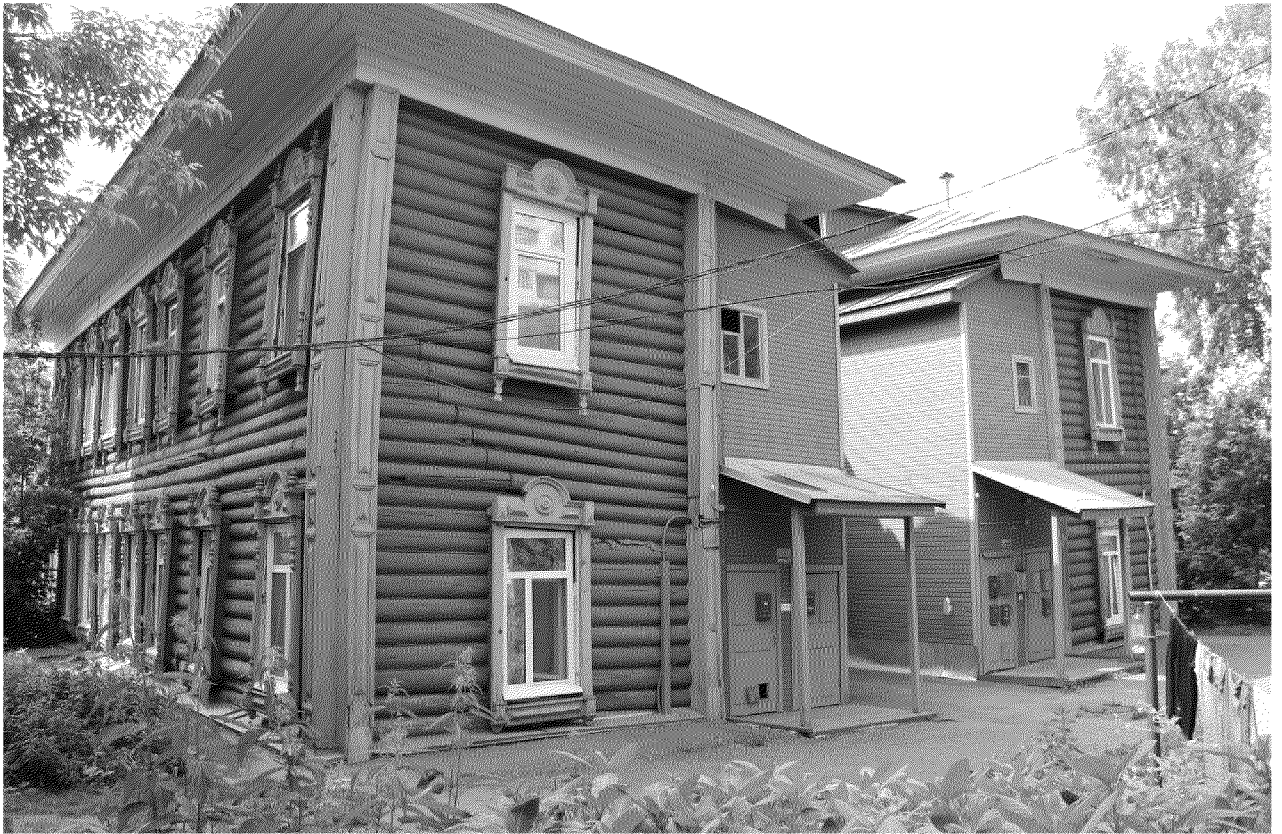
Видовая точка № 6. Общий вид здания с юго-восточной стороны