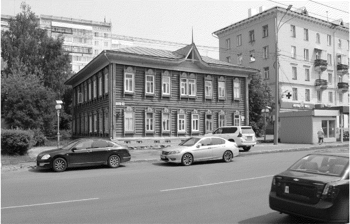
Видовая точка № 1. Общий вид здания с пр. Ленина

Автор снимков: архитектор I категории ОГАУК "Центр по охране памятников" Олейник А.Ю., дата съемки: 03.07.2019 г.