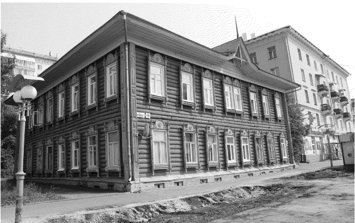
Видовая точка № 2. Вид здания с северо-западной стороны