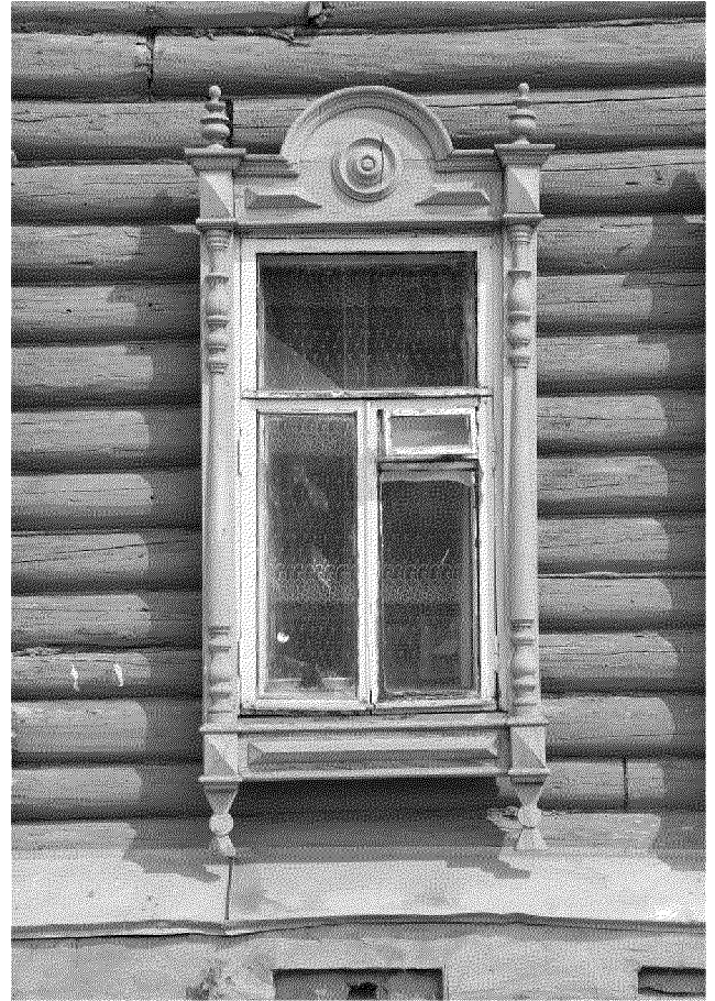
Видовая точка № 4. Окно 1-го этажа главного фасада с наличником