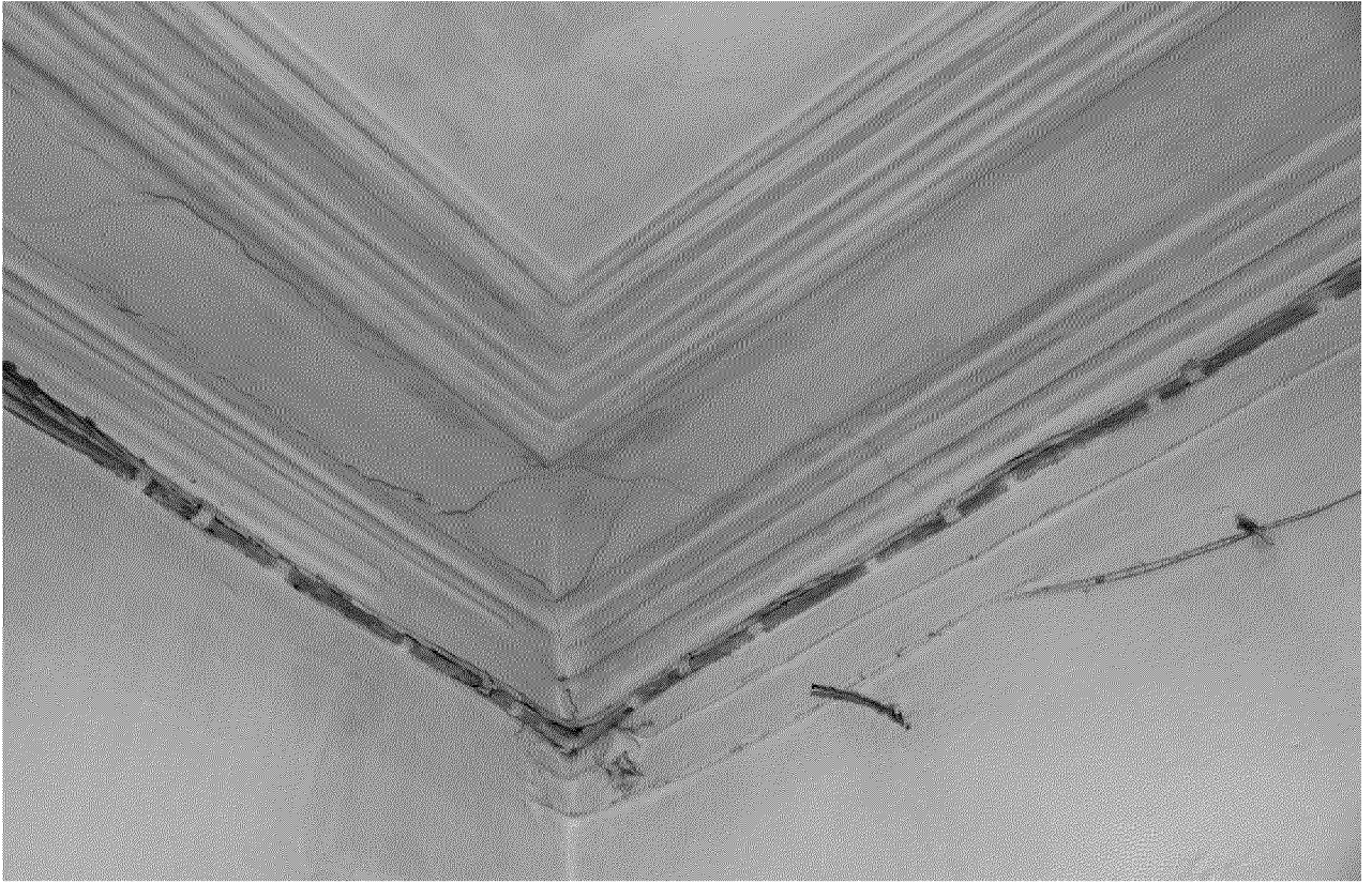
Видовая точка № 9.

Профильные потолочно-стенные штукатурные тяги (2015 г.)