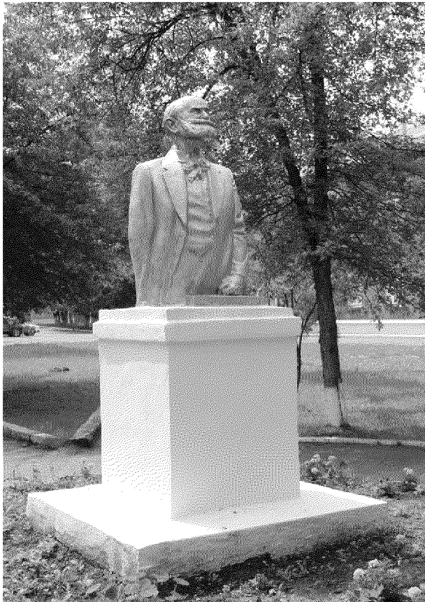
Видовая точка № 5. Памятник академику И.П. Павлову