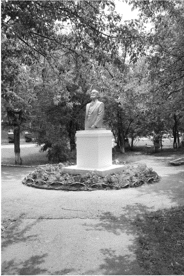
Видовая точка № 3. Общий вид памятника академику И.П. Павлову