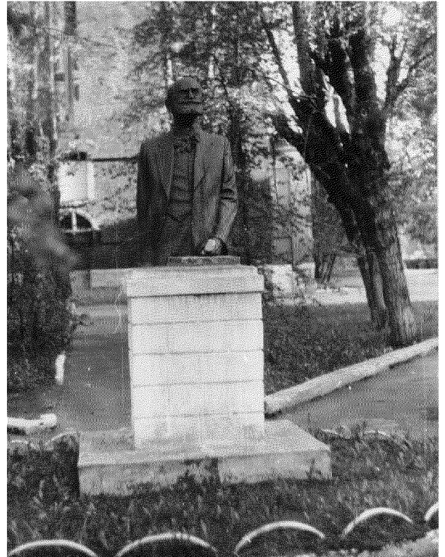
Памятник академику И.П. Павлову