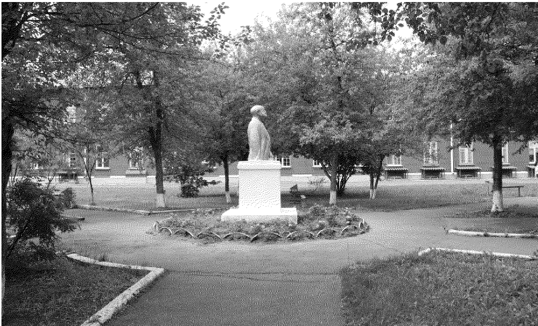
Видовая точка № 2.

Общий вид сквера на внутри дворовой территории