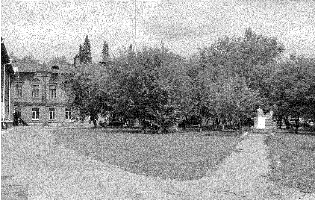
Видовая точка № 1.

дата съемки: 16.07.2018 г.