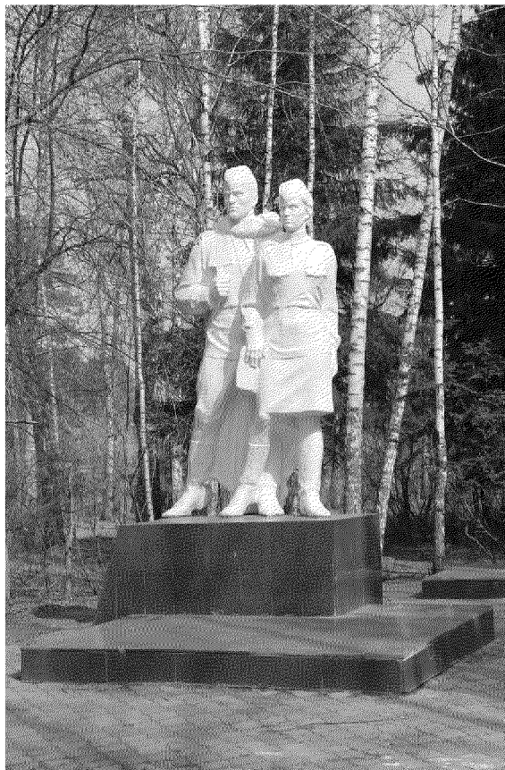
Видовая точка № 5. Фрагмент памятника, скульптурная группа.