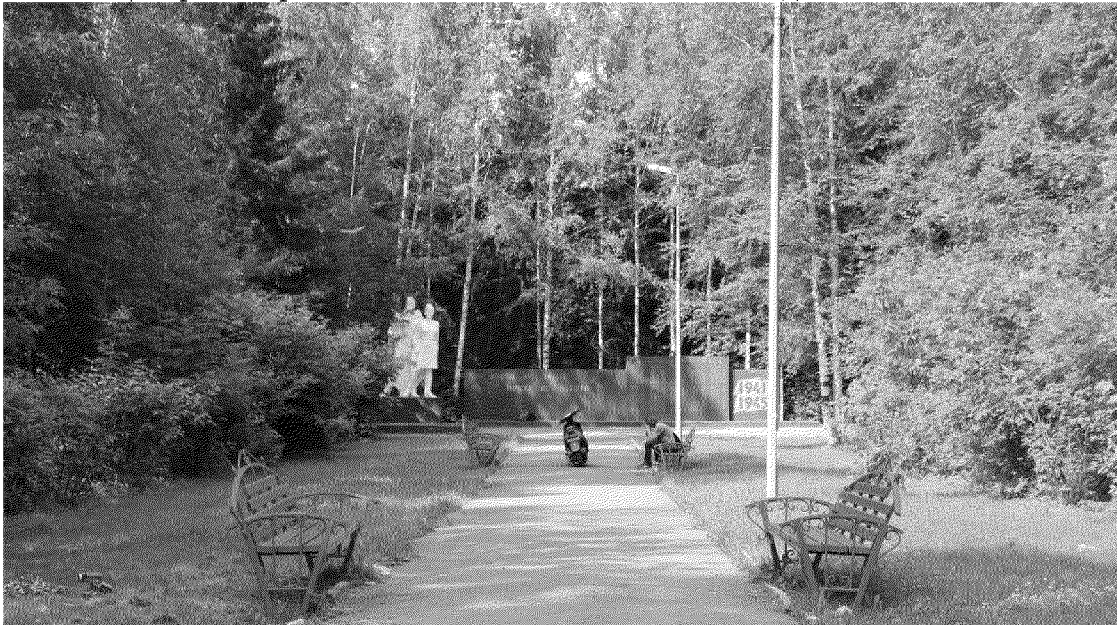
Видовая точка № 1. Общий вид памятника с центральной аллеи

дата съемки: 20.04.2020 г.