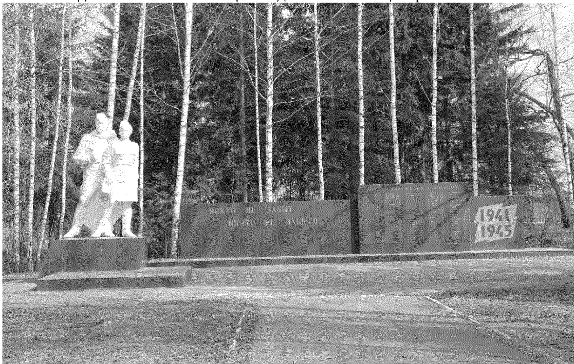
Видовая точка № 2. Вид памятника с центральной аллеи