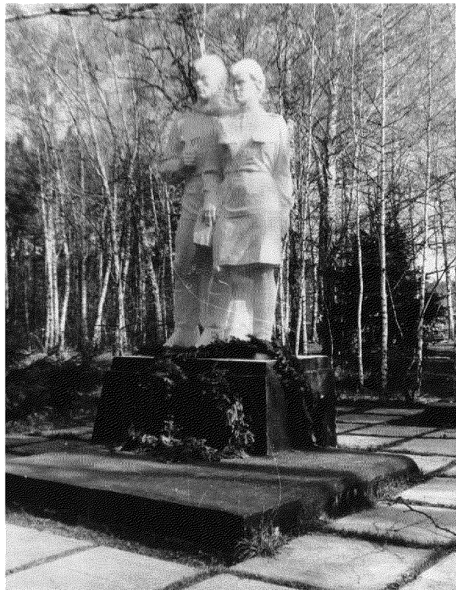
Видовая точка № 6. Фрагмент памятника, скульптурная группа (по состоянию на 1998 г.)