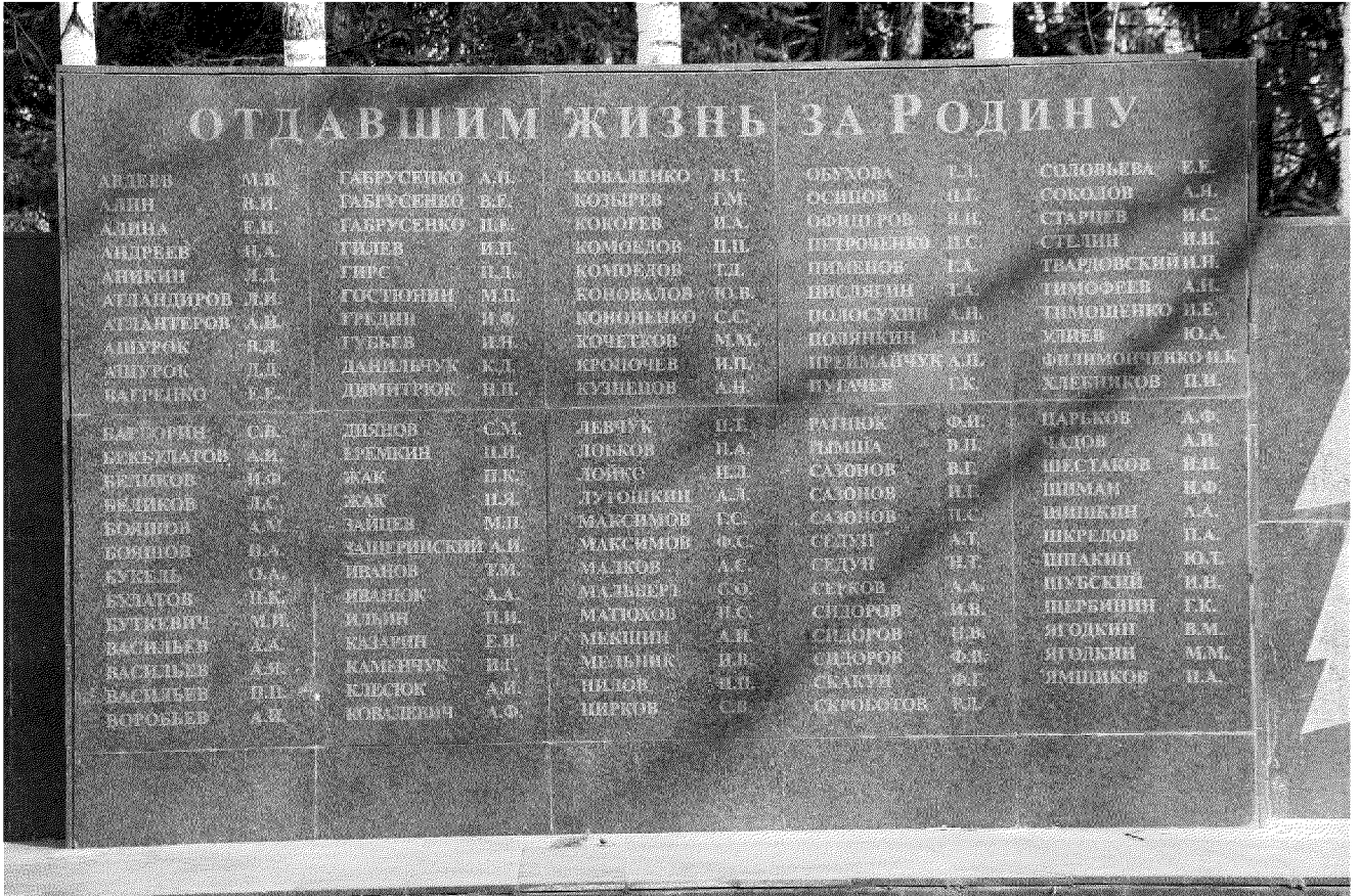
Видовая точка № 4. Фрагмент памятника, мемориальная стела