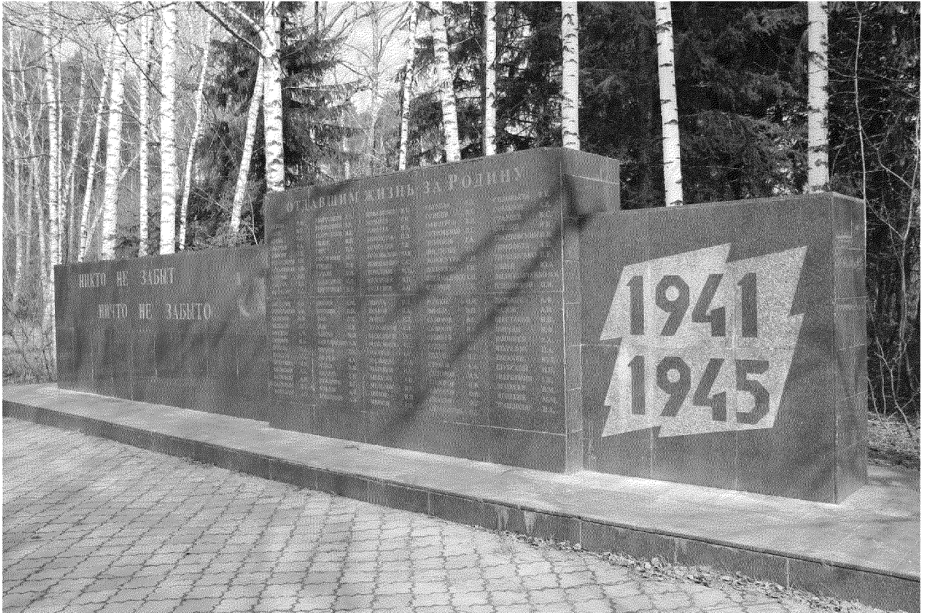
Видовая точка № 3. Фрагмент памятника, мемориальная стела