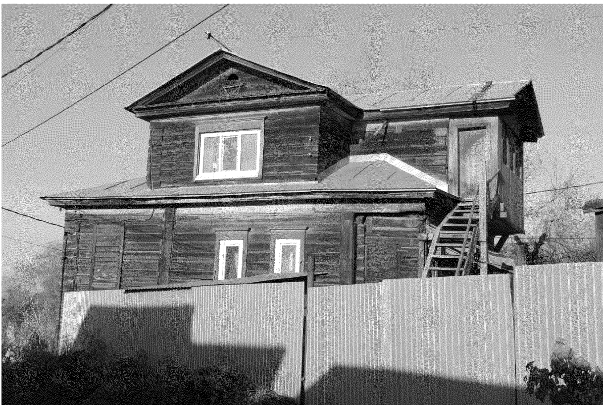
Видовая точка № 4. Восточный фасад здания, вид с пер. Песочного