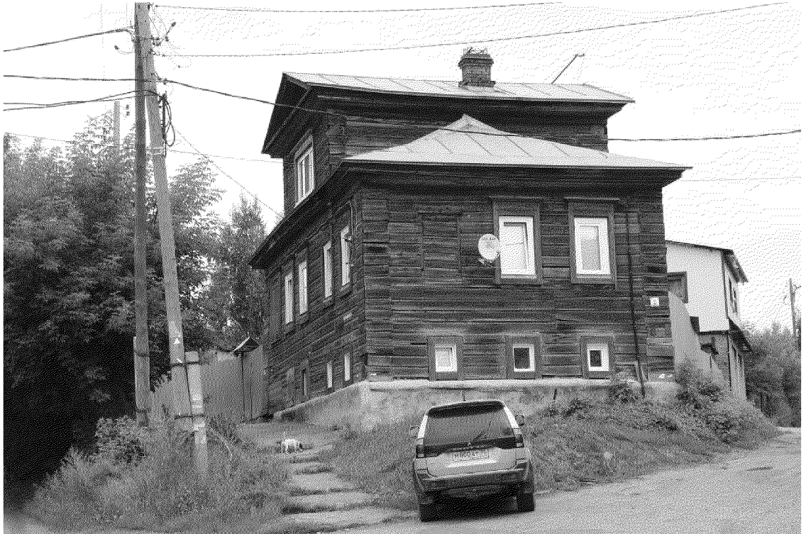
Видовая точка № 2.

Общий вид здания в строчке застройки ул. Октябрьской (Яблонская М.А., 02.08.2024)