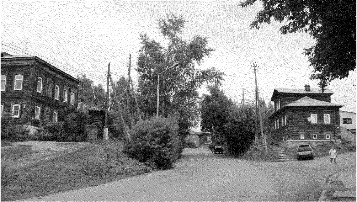
Видовая точка № 1.

Общий вид здания в строчке застройки ул. Октябрьской