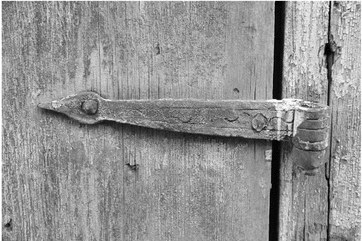
Видовая точка № 10. Кованая скобяная фурнитура ставней окна 1-го этажа западного фасада