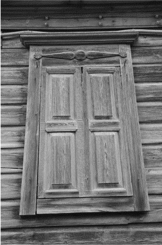
Видовая точка № 8. Наличник 2-го этажа западного фасада со ставнями