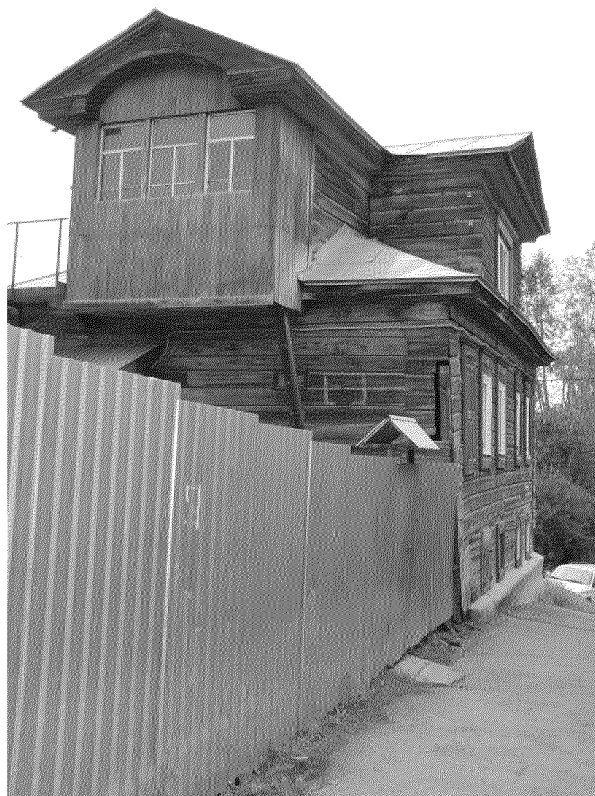
Видовая точка № 5. Северный фасад здания с балконом