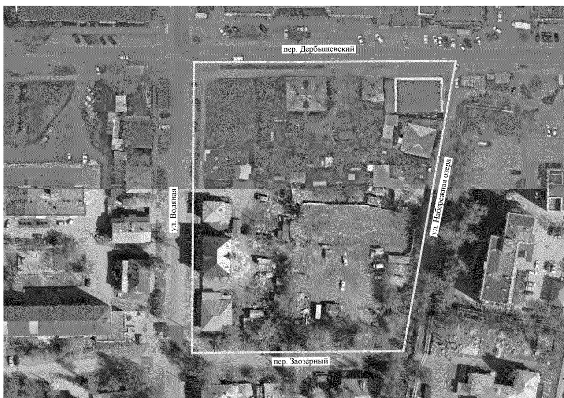
Схема границ территории, ограниченной пер. Дербышевским, ул. Набережной озера, пер. Заозерным, ул. Водяной в городе Томске.

Приложение к приказу Департамента градостроительного развития Томской области от 23.12.2024 № 71