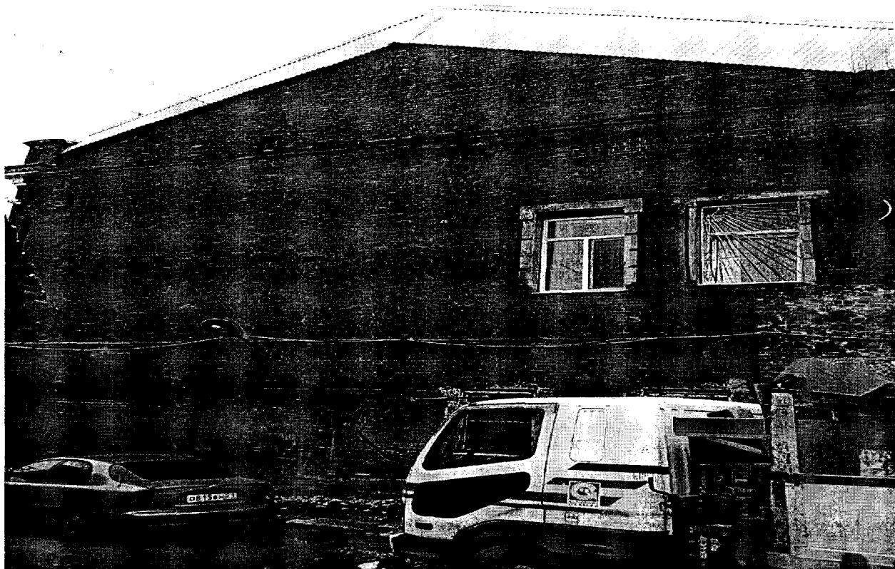
Фото 6. Фрагмент северо-западного фасада.