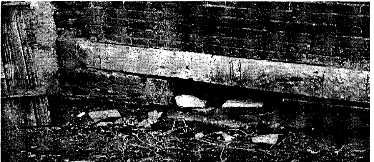
Фото 5. Разрушение цоколя на северо-западном фасаде.