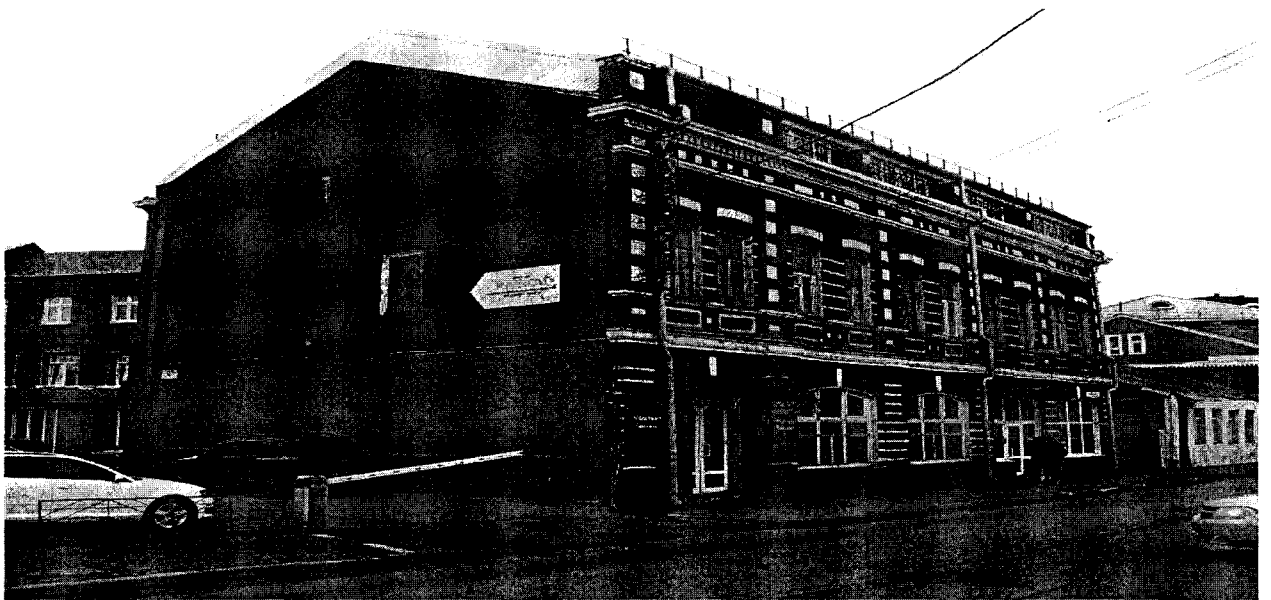
Фото 3. Вид с северо-востока.