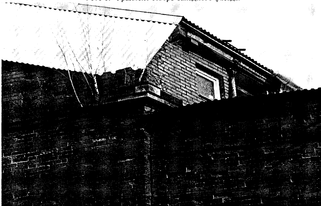
Фото 7. Фрагмент северо-западного фасада.