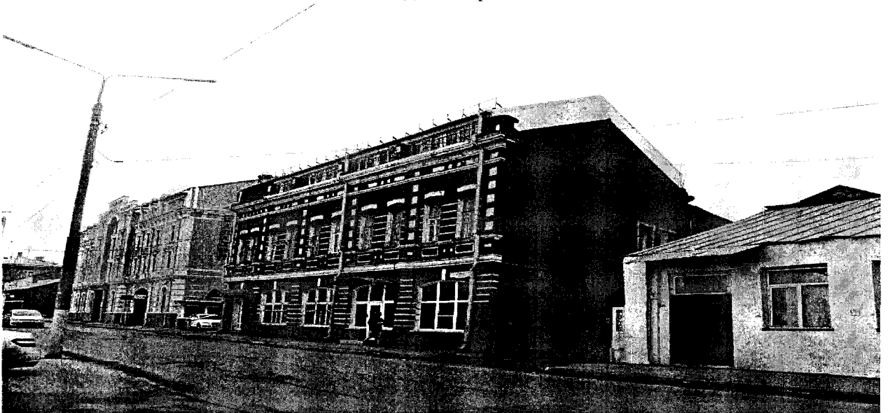
Фото 4. Вид с северо-запада.