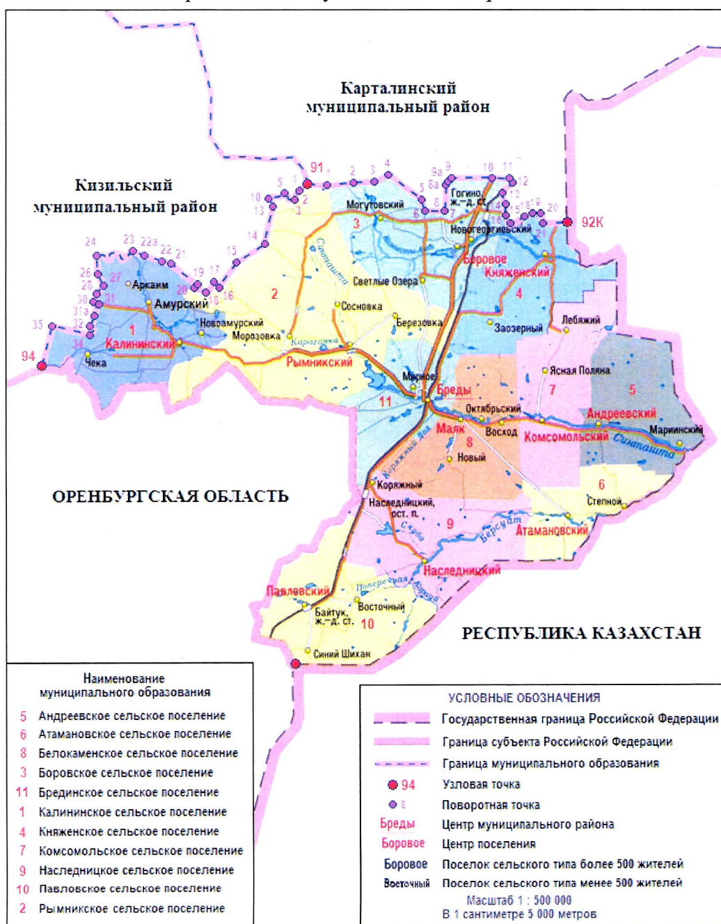
СХЕМА ГРАНИЦ Брединского муниципального района

«Приложение 2 к Закону Челябинской области «О статусе и границах Брединского муниципального района Челябинской области и сельских поселений в его составе»