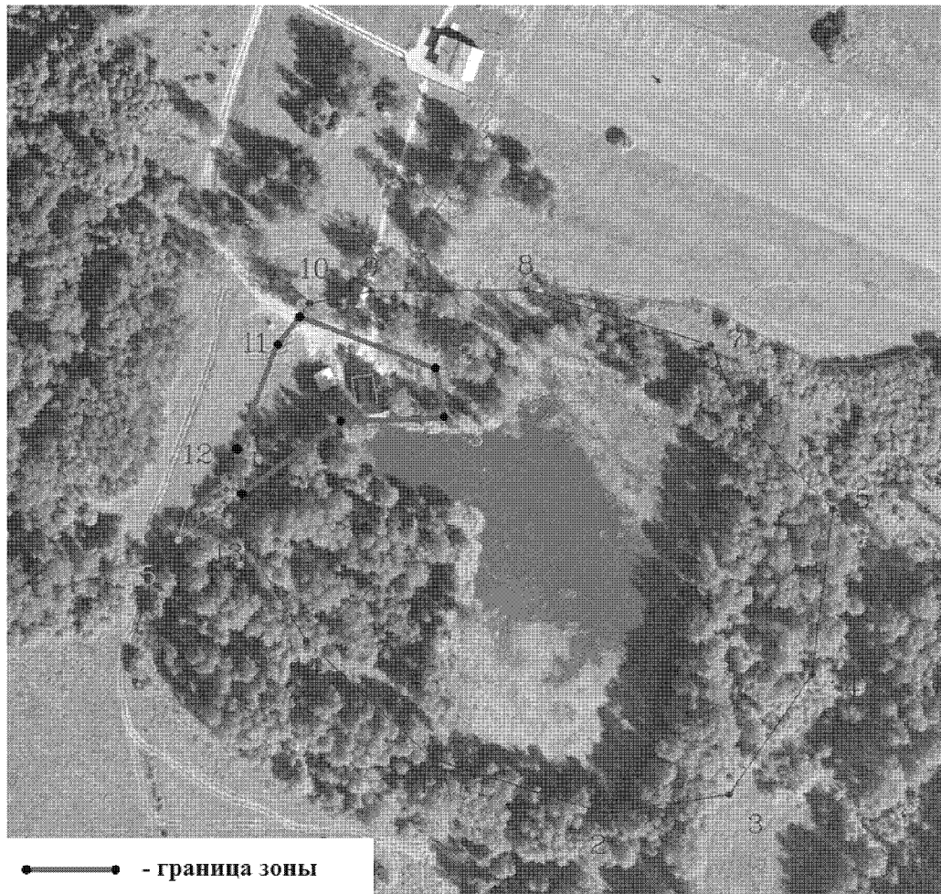
Схема границ зоны