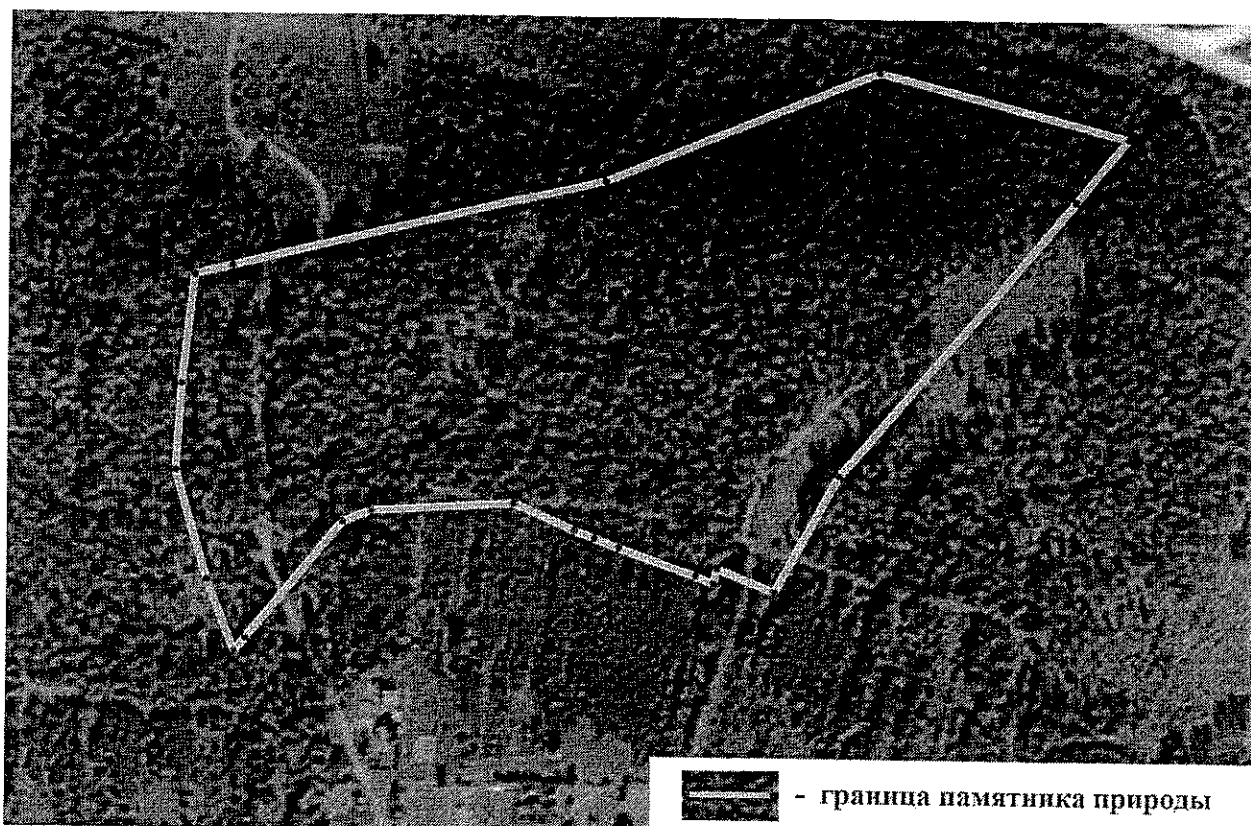
СХЕМА границ памятника природы «Сосновый бор с. Неверова»