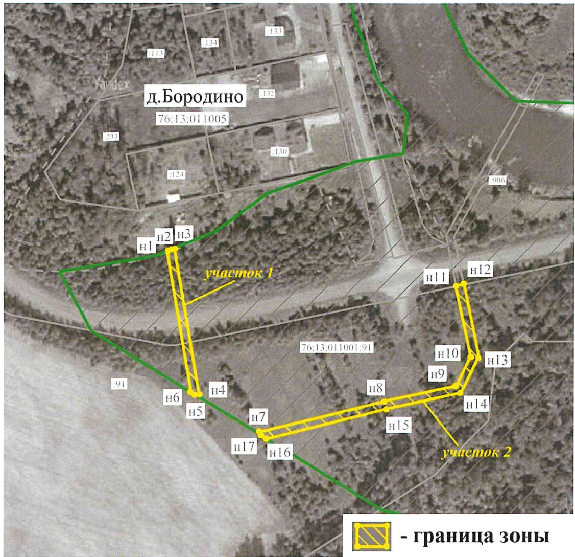
Схема границ зоны