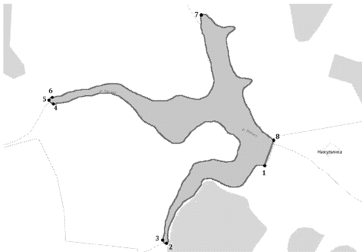
Географические координаты точек*