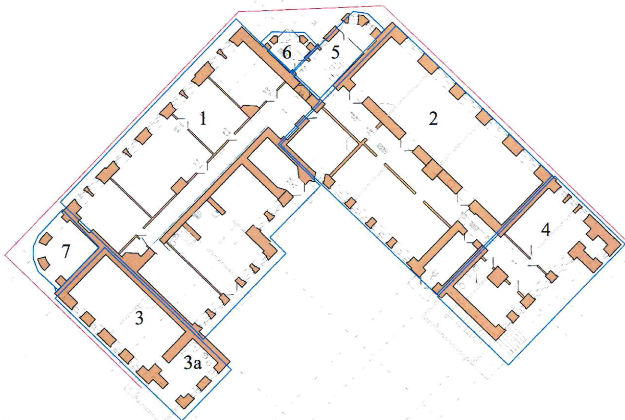
СХЕМА расположения объемов и элементов предмета охраны объекта культурного наследия местного (муниципального) значения (памятника) «Здание конторы фабрики «Рольма» с квартирами служащих», 1908 г. (Ярославская область, г. Ростов, ул. Пролетарская, д. 86)