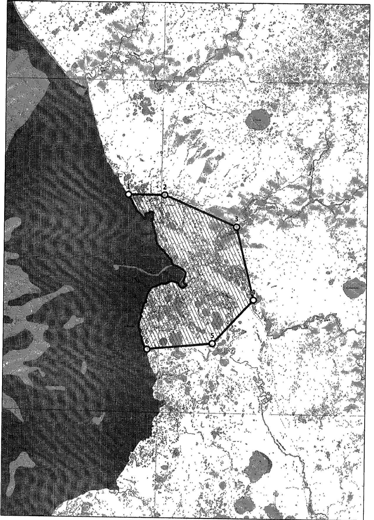
Рисунок 11. Карта-схема границ охотничьего участка № 2, планируемого к закреплению.»;