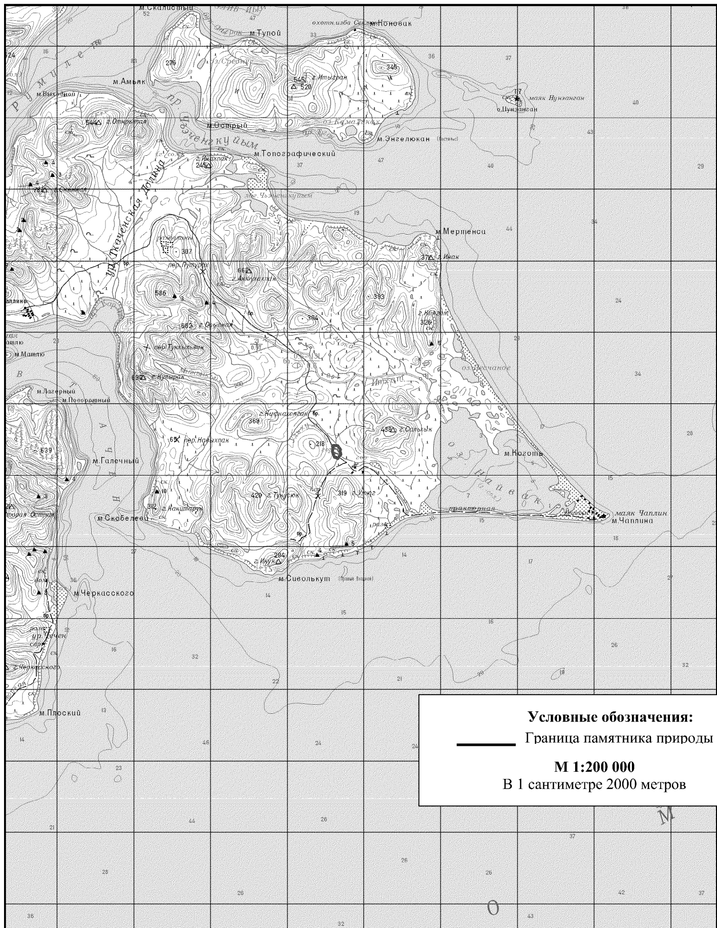
СХЕМА расположения памятника природы регионального значения «Чаплинский»