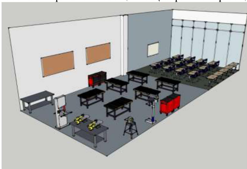
Схема зонирования помещения Центра в 3D-проекции