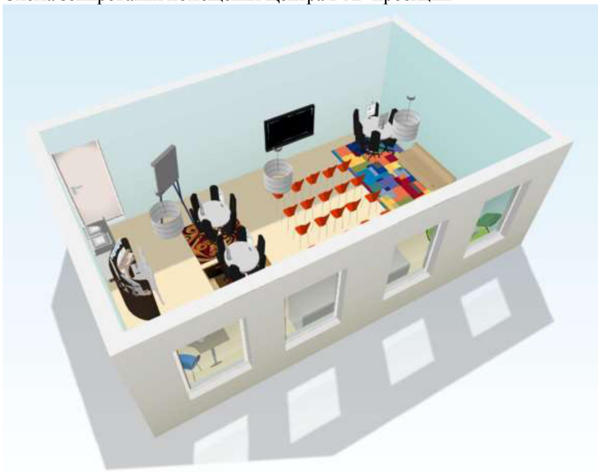
Схема зонирования помещения Центра в 3D-проекции