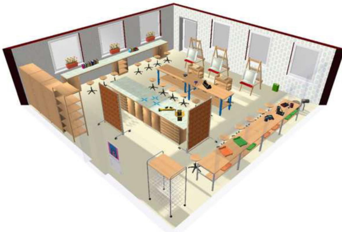
Схема зонирования помещения Центра 3D-проекции