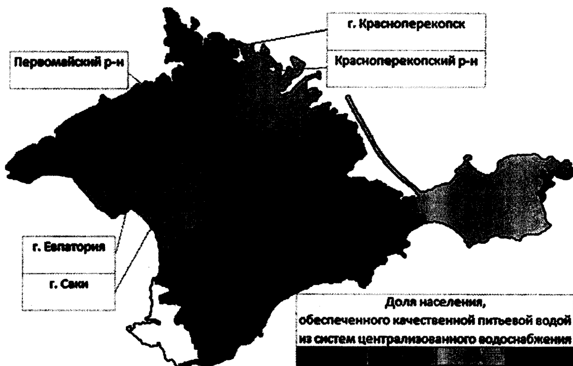
Рисунок № 2. Распределение качества воды по районам и городам Республики Крым по данным МУ Роспотребнадзора

водоснабжения, в Республике Крым составила 78 %, в т.ч. городского населения – 79,2 %. Следует отметить, что данные МУ Роспотребнадзора учтены в Государственном докладе «О состоянии санитарно-эпидемиологического благополучия населения в Российской Федерации в 2018 году» и сопоставимы с базовыми целевыми показателями паспорта федерального проекта «Чистая вода».