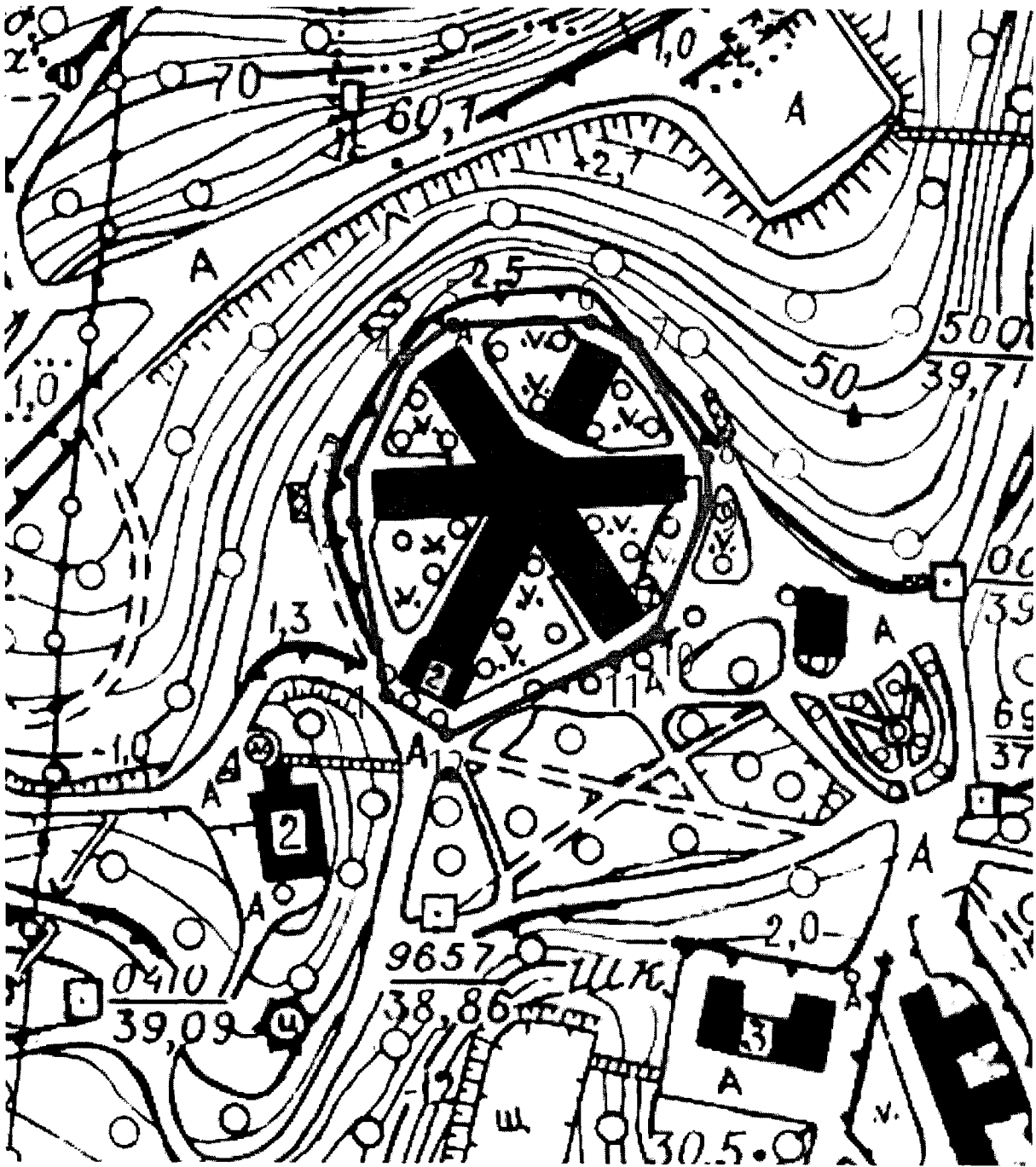
Схема границ территории