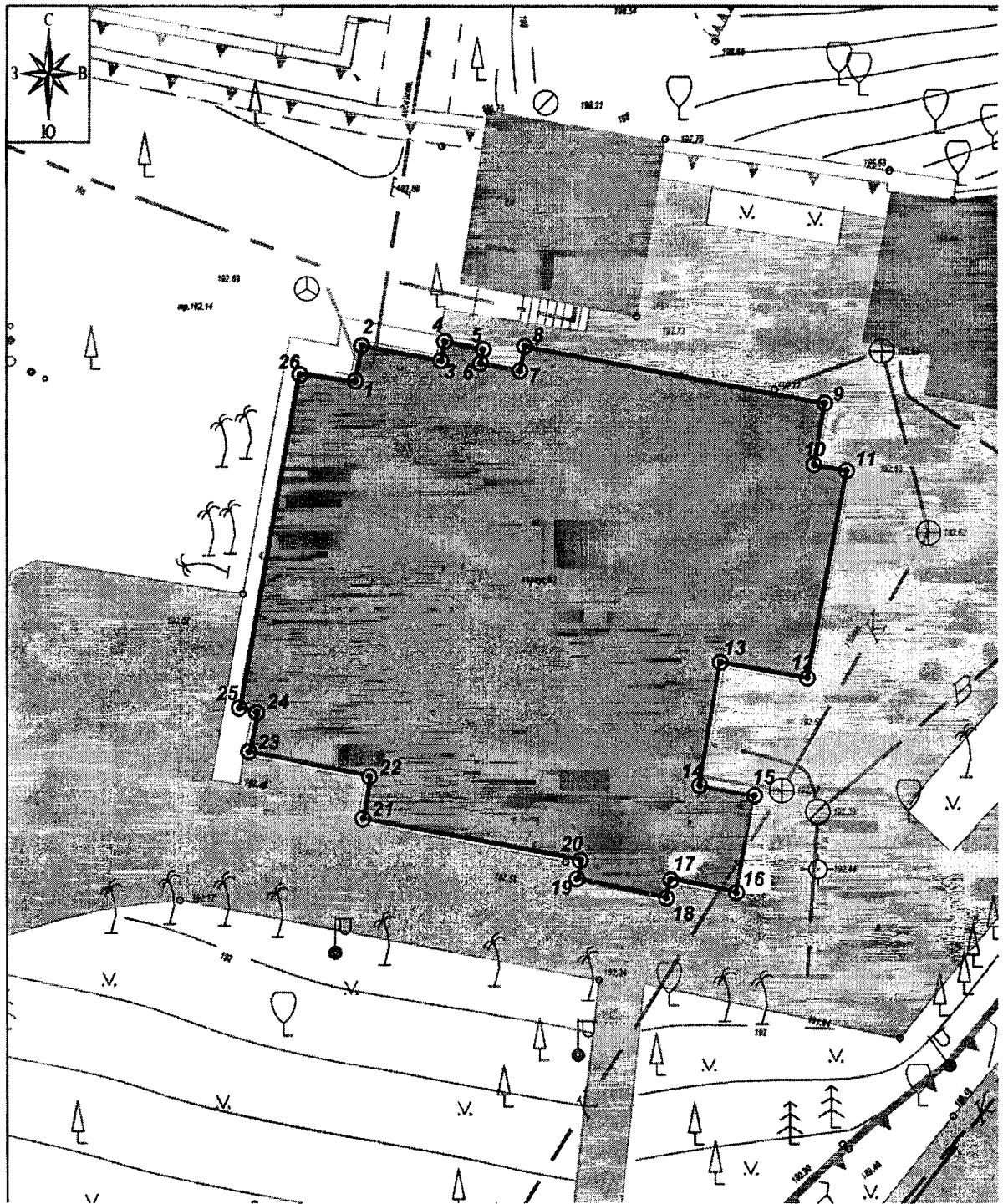
Схема границ территории объекта культурного наследия