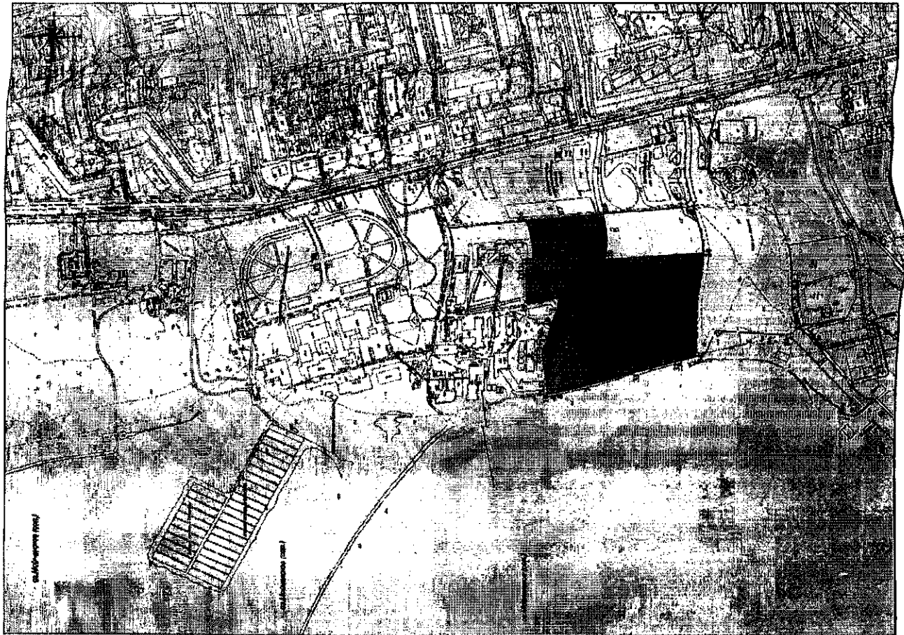
Схема границ территории и зон охраны объекта культурного наследия регионального значения «Усадьба Мойнакской грязелечебницы (архитектор А. О. Бернардацци), 1894 год» расположенный по адресу: Республика Крым, г. Евпатория, ул. Франко, д. 30 лит. А, корпус 1