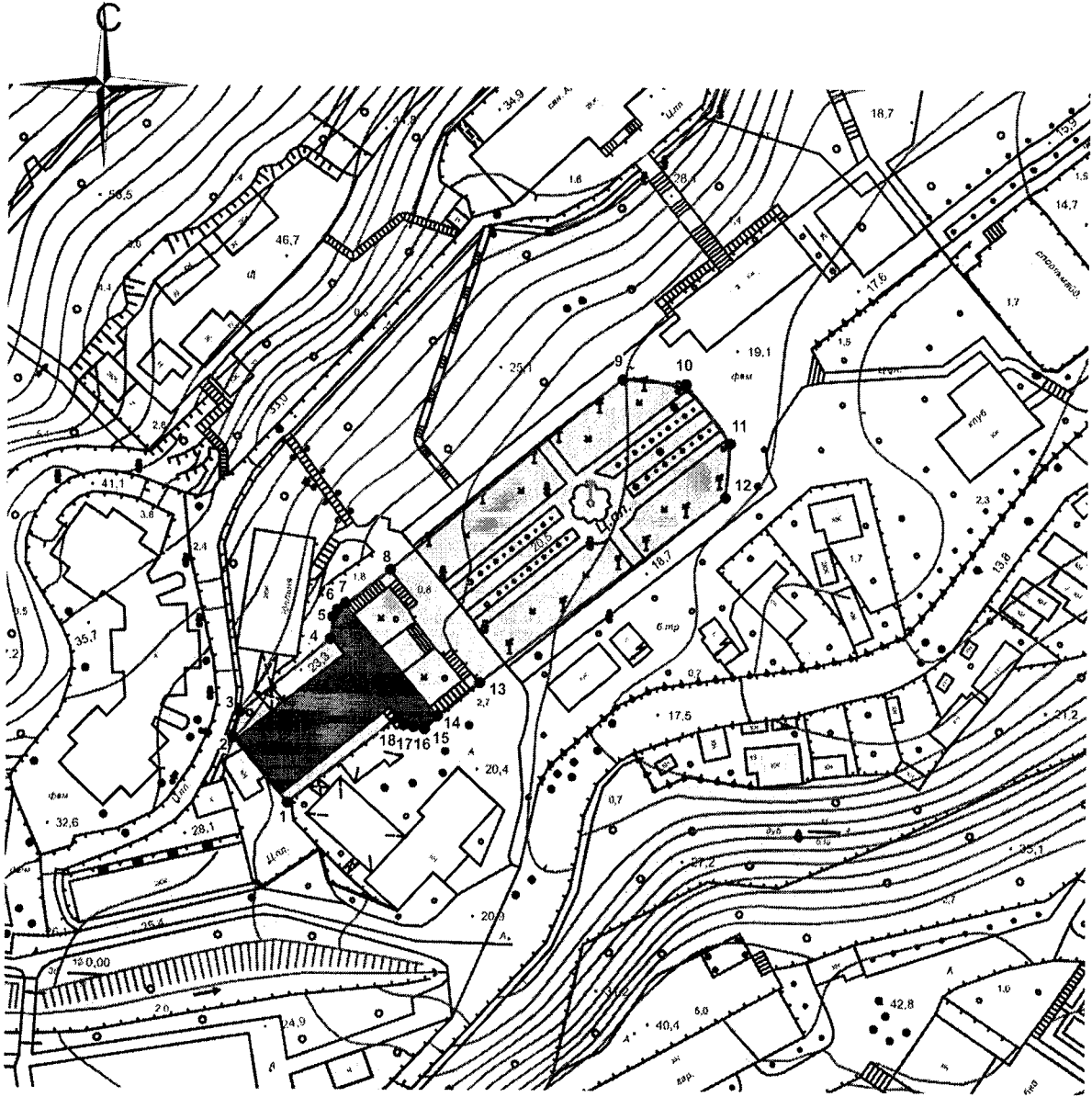
Схема границ территории