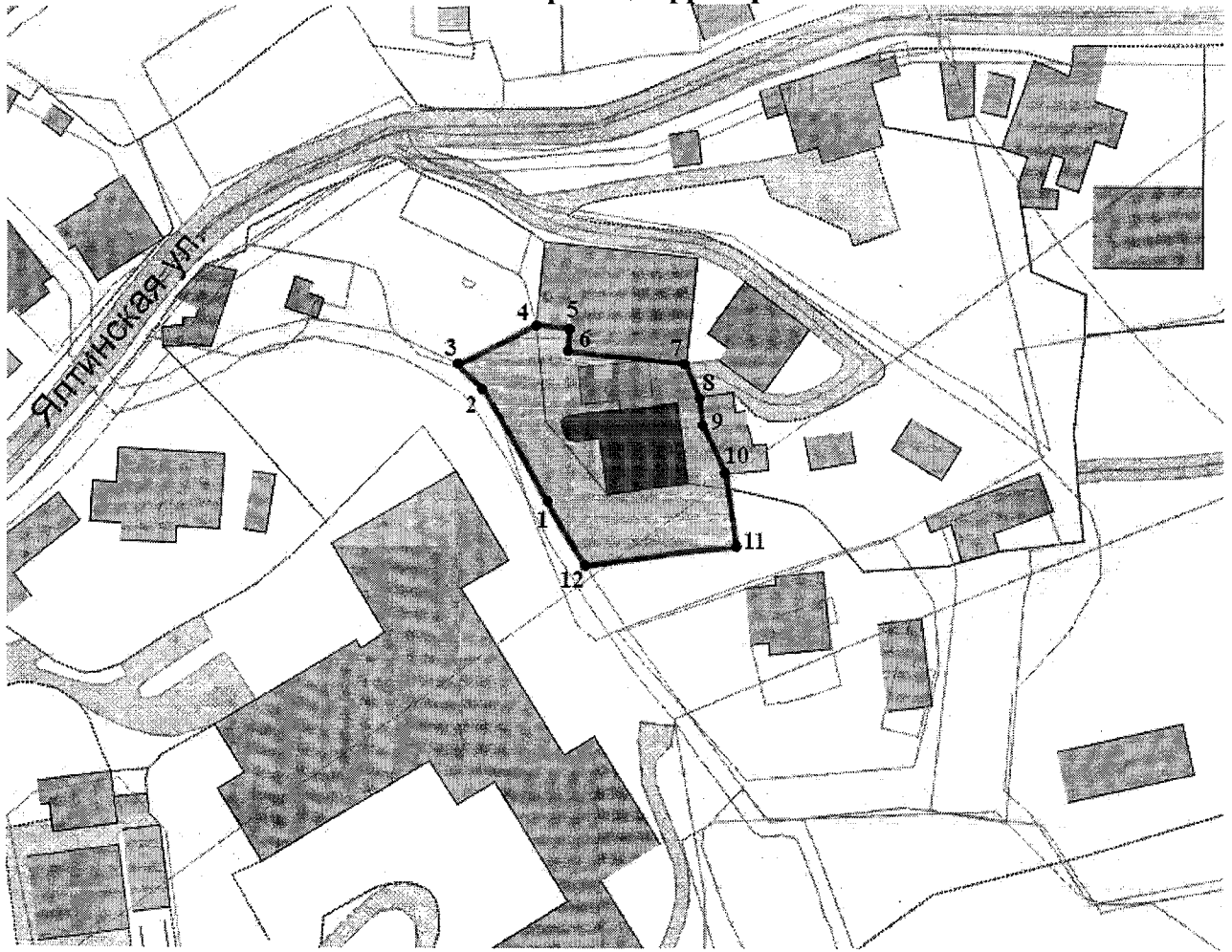
Схема границ территории

Условные обозначения: 1,2,3... - поворотные точки