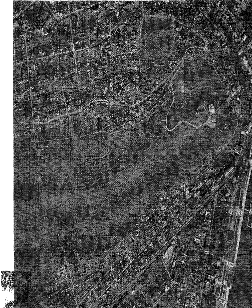
Схема границ территории объекта культурного наследия федерального значения «Архитектурно-археологический комплекс «Древний город Пантикапей», расположенному по адресу: Республика Крым, г. Керчь, гора Митридат.