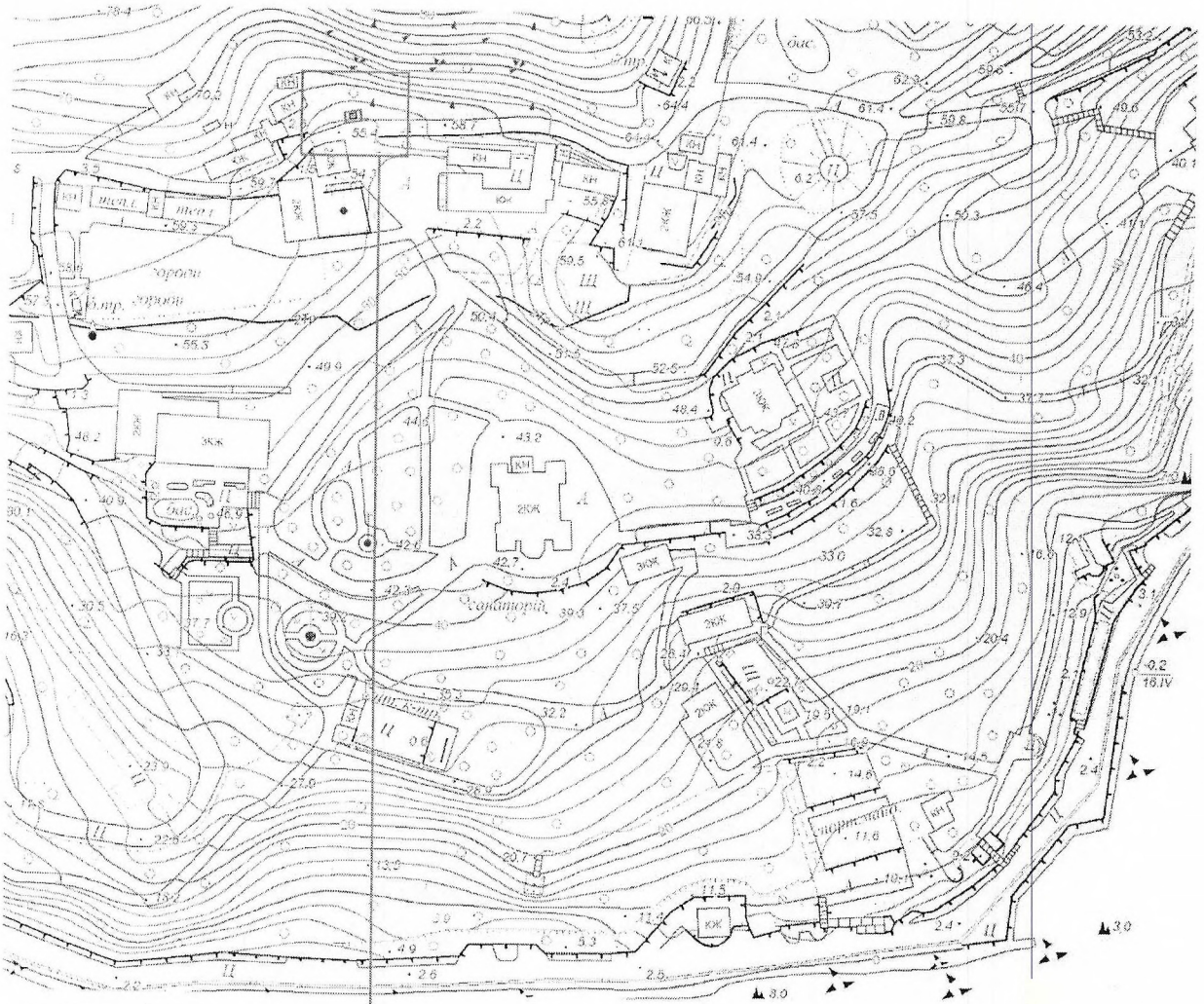
Схема границ территории